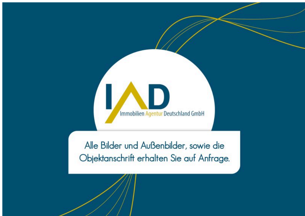
Bilder auf Anfrage