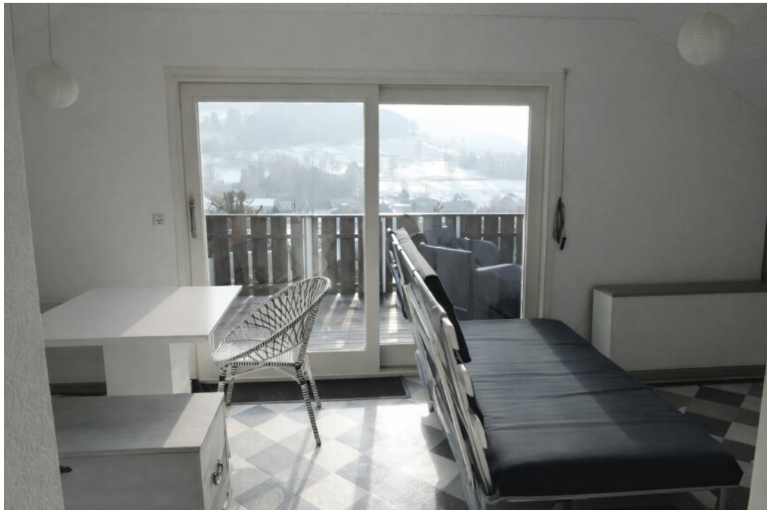
Wohnzimmer Ausgang Balkon