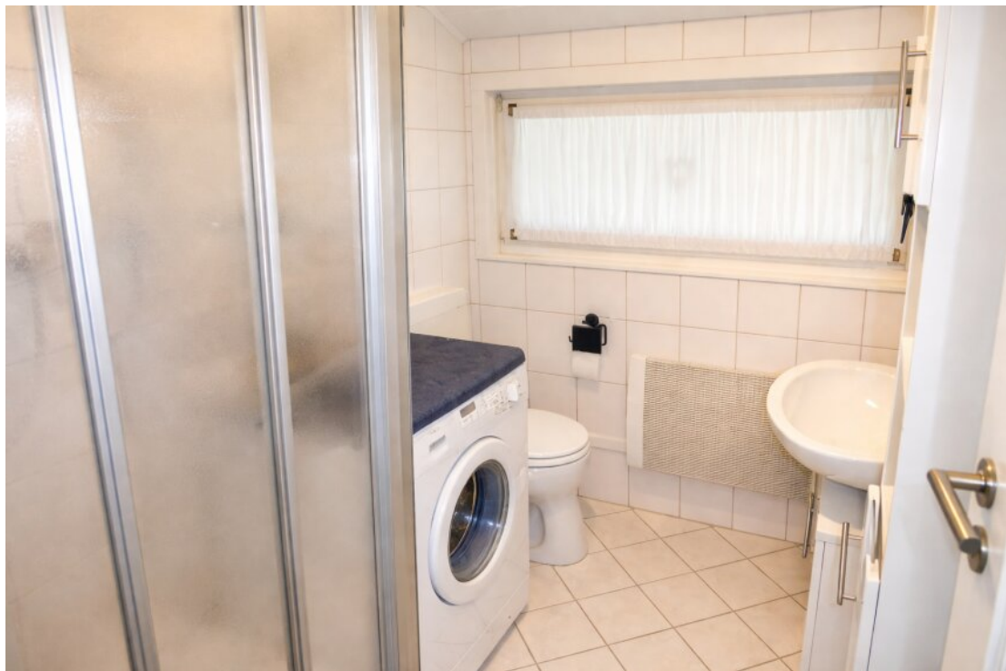
Bad Dusche und WM Anschluss