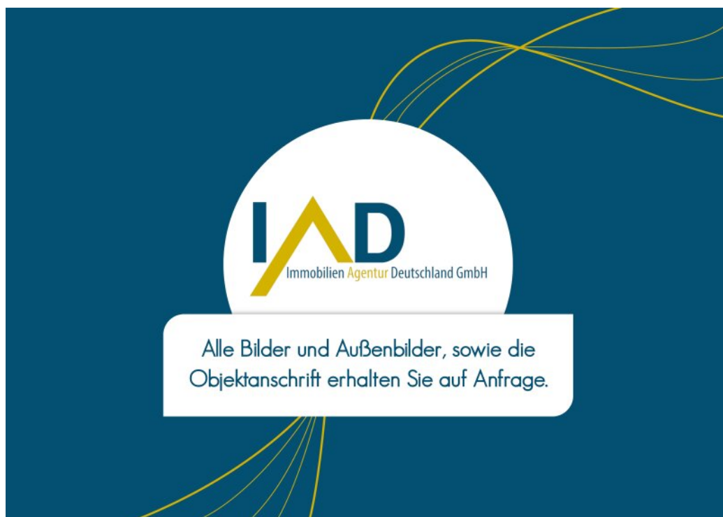
IAD Bilder auf Anfrage