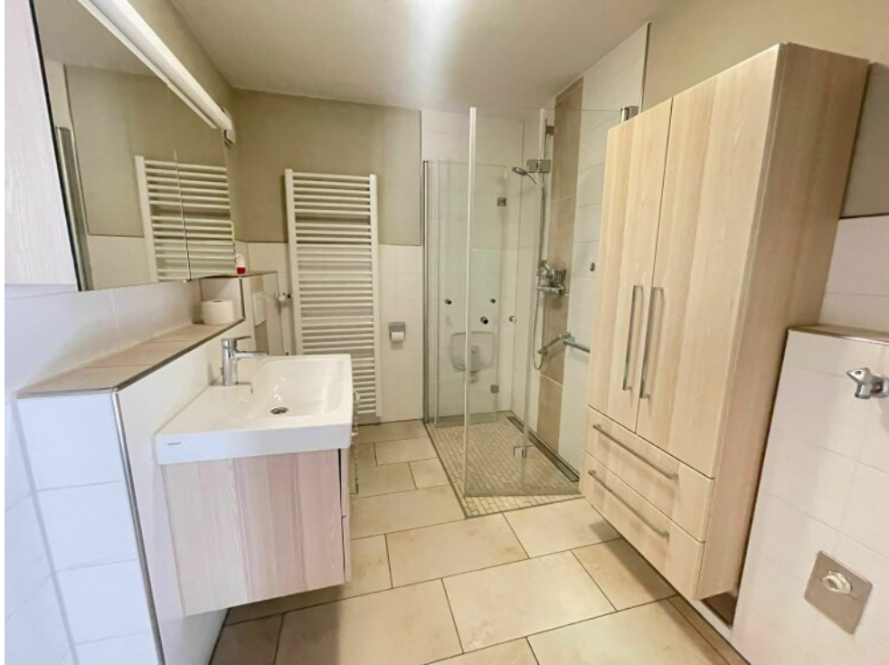
Bereits Saniertes Badezimmer