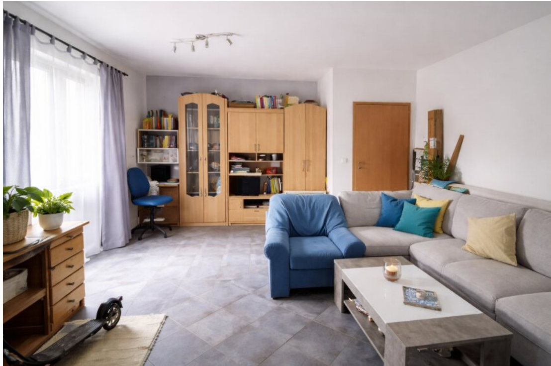
Helles Wohnzimmer mit stilvollem Mobiliar (2)