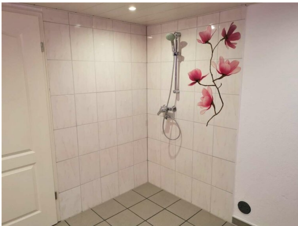
Waschküche mit Dusche