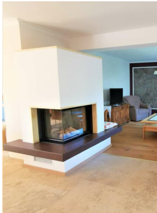
Brunner Holzkamin im Wohnbereich