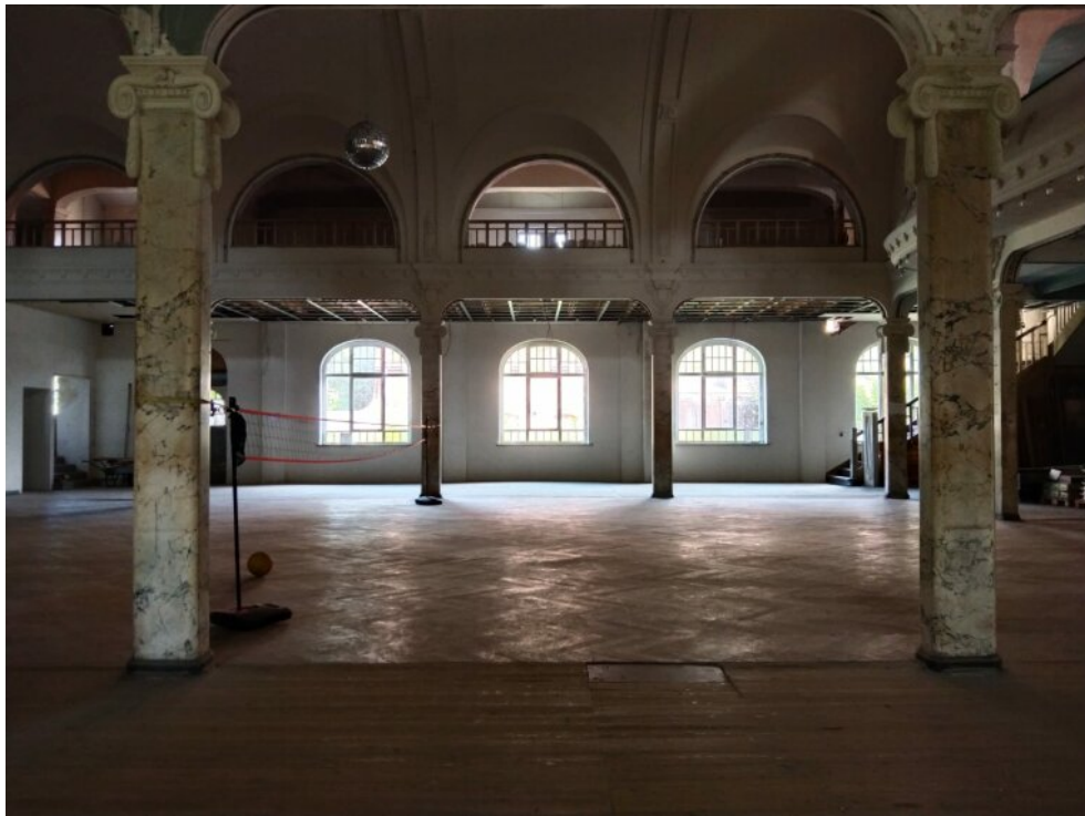
Saal mit Bühne und umlaufender Empore