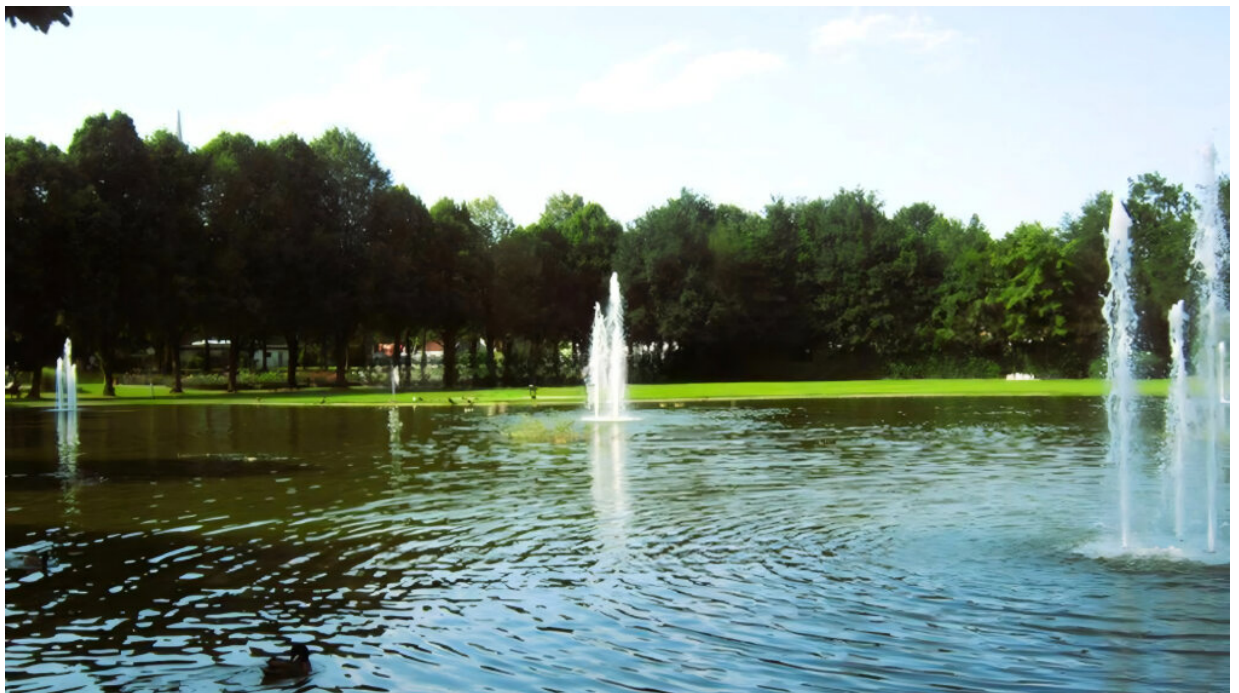
Kurort Bad Füssing