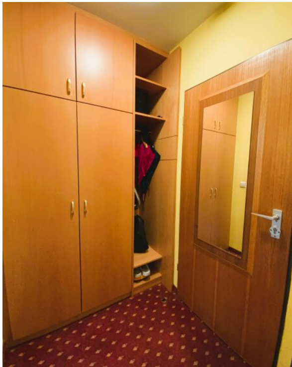
Flur mit Einbauschränk