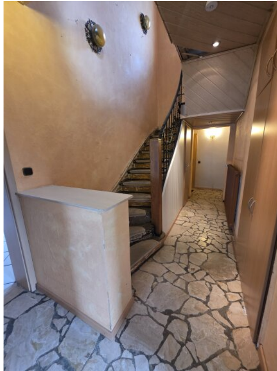
Flureingang mit Marmor