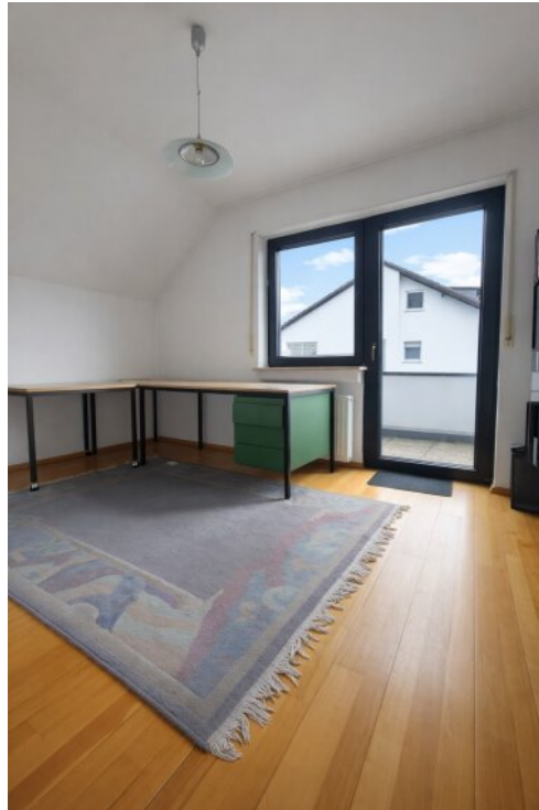
Zimmer im OG