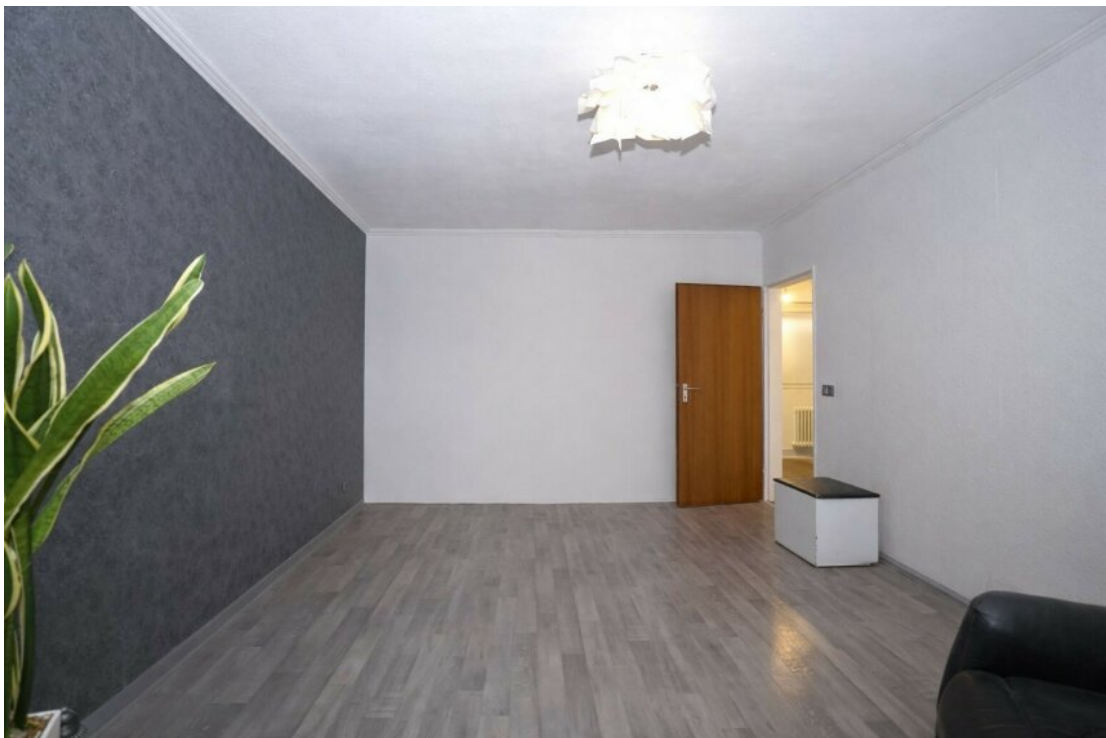
Wohnzimmer mit Balkonzugang