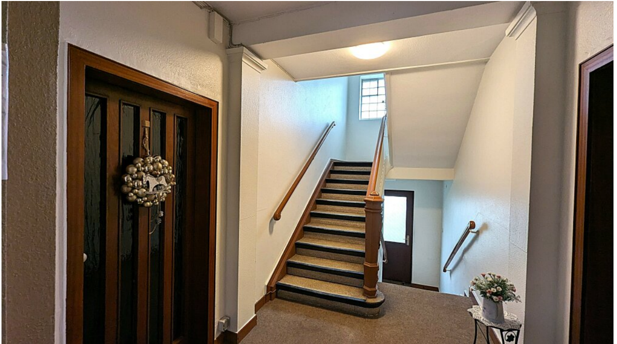
Treppenhaus + Wohnungseingang