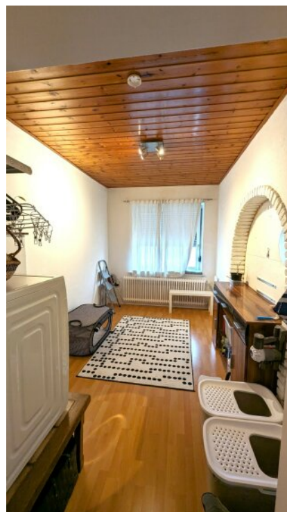
3. Zimmer mit Durchgangsoption