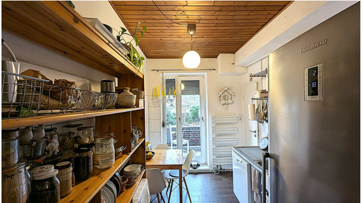
Küche mit Balkon