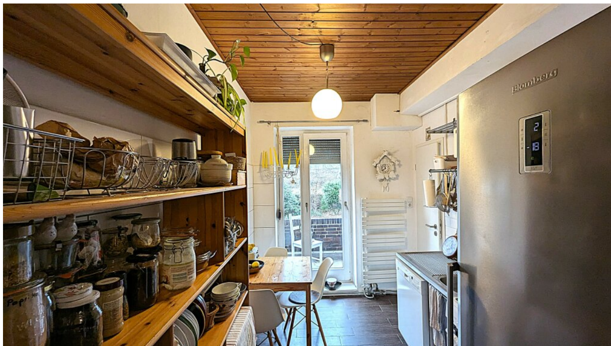
Küche mit Balkon