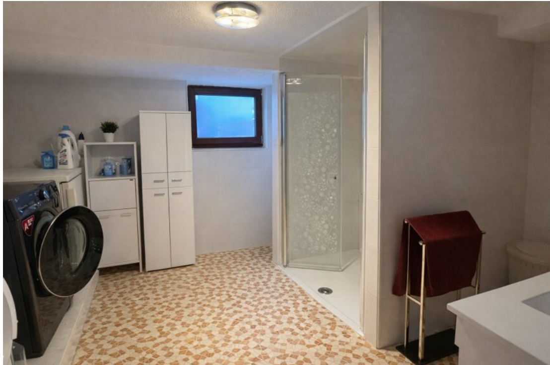
Wäscheraum KG mit Dusche