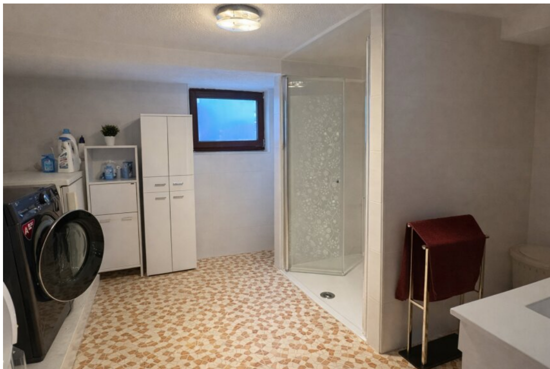
Wäscheraum KG mit Dusche