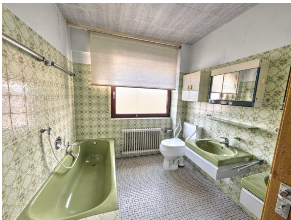
Bad mit Dusche und Wanne