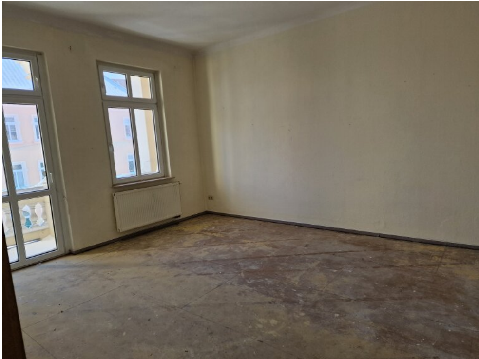
Zimmer 1 - Whg OG