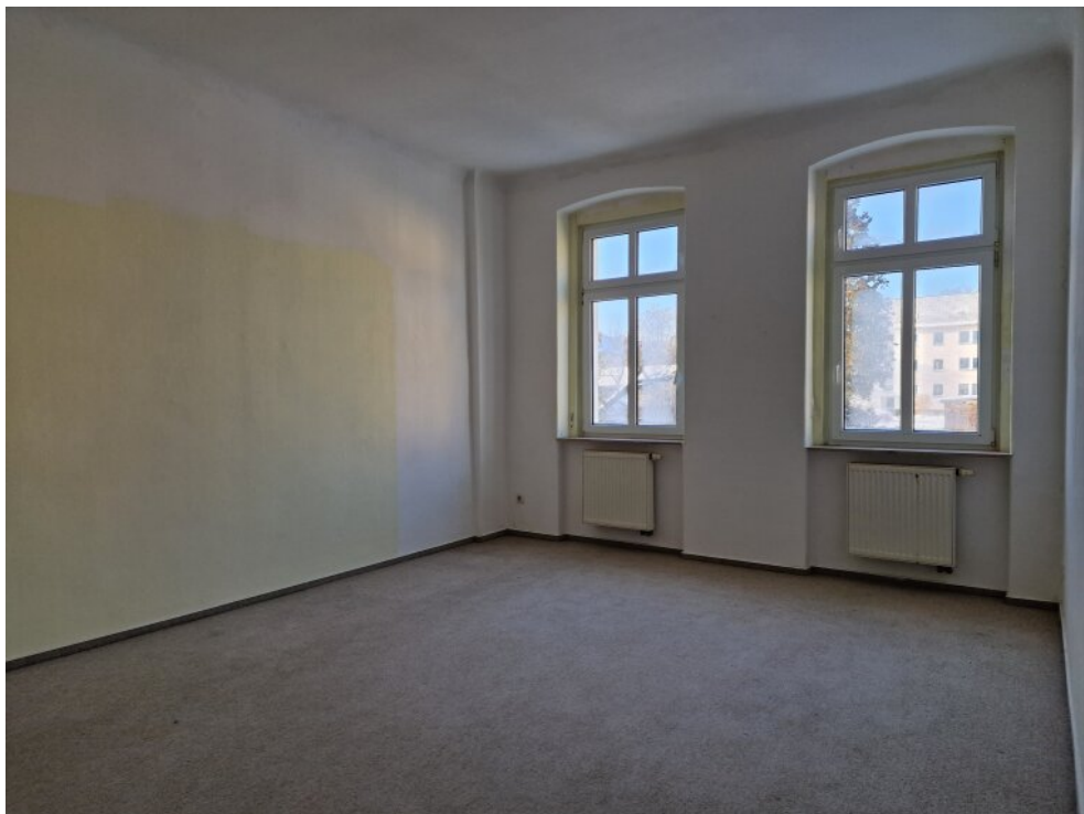
Zimmer 3 - Whg OG