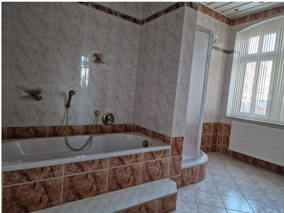
Bad - Whg EG