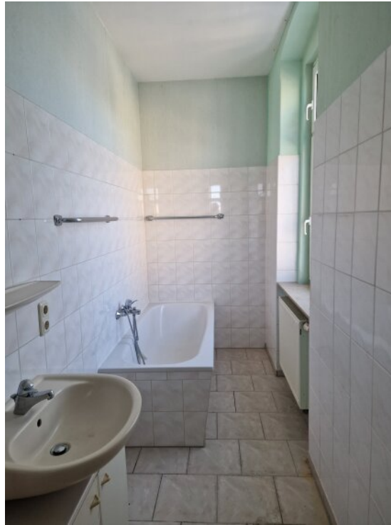
Bad - Whg OG