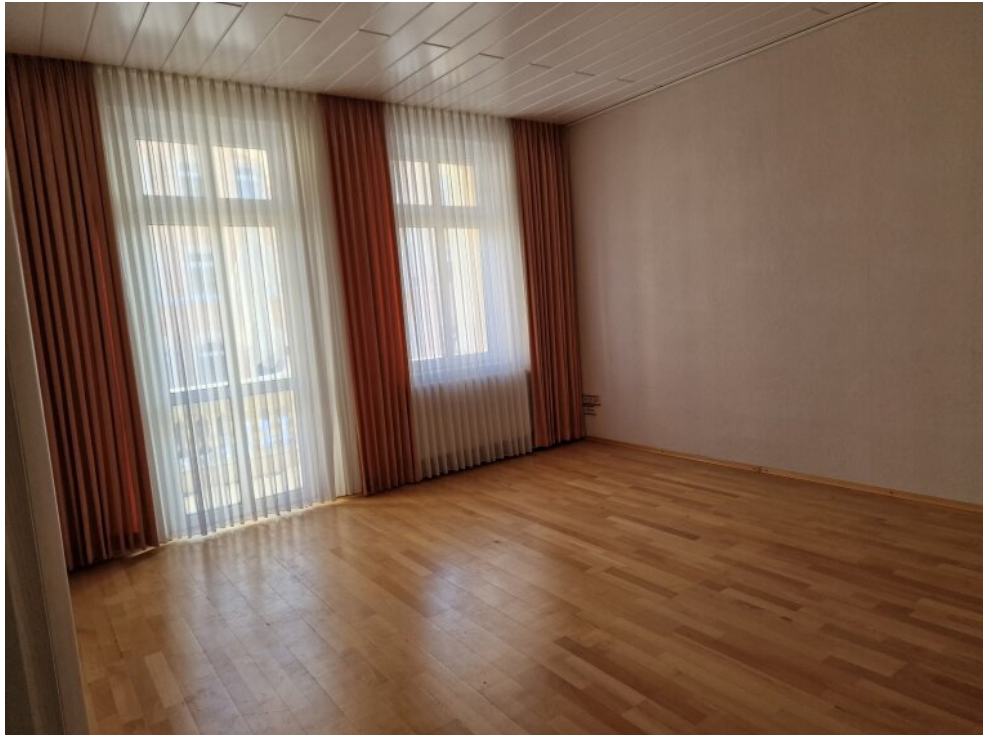
Wohnzimmer - Whg EG