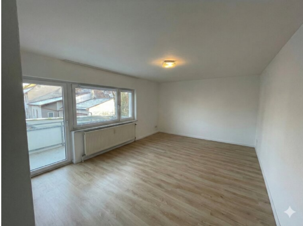
Kinderzimmer OG - Vorderhaus