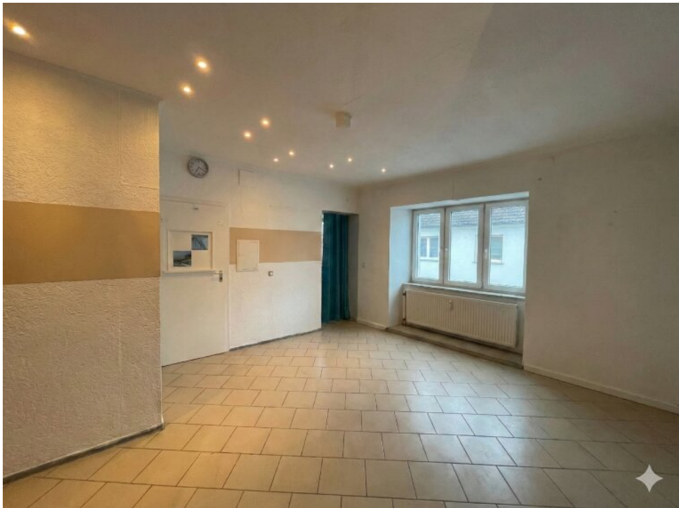
Wohnzimmer EG Vorderhaus