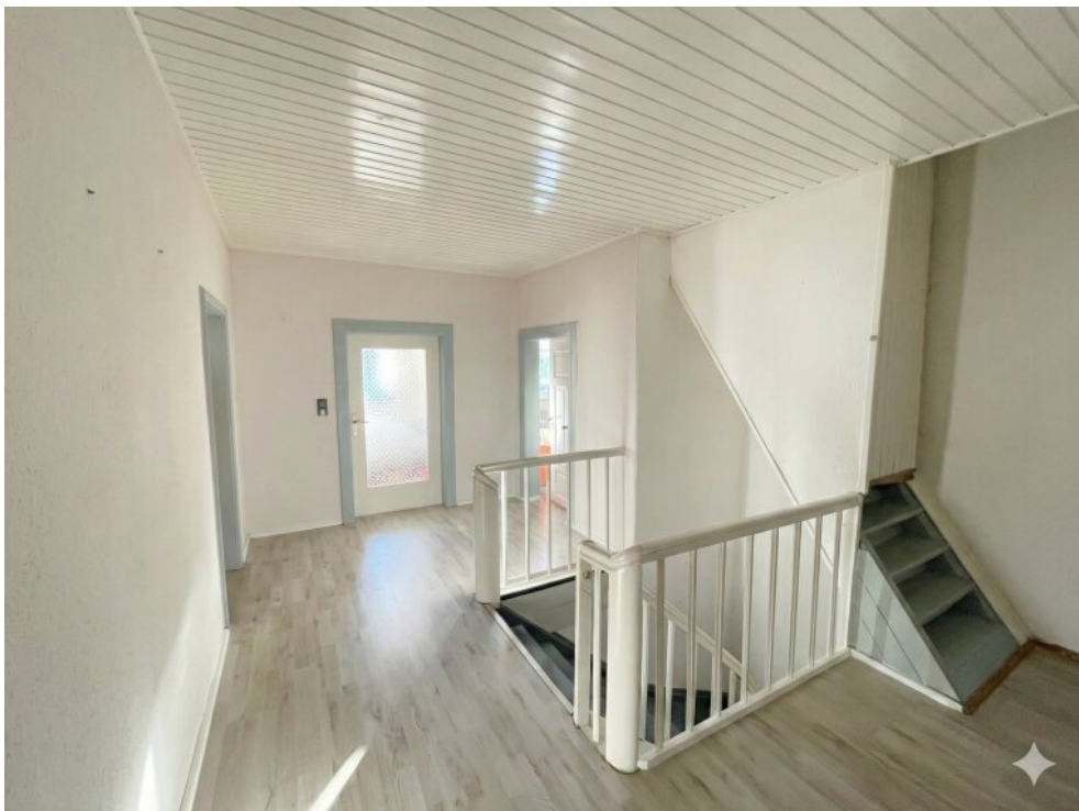
Eingangsbereich Wohnung OG-Vorderhaus