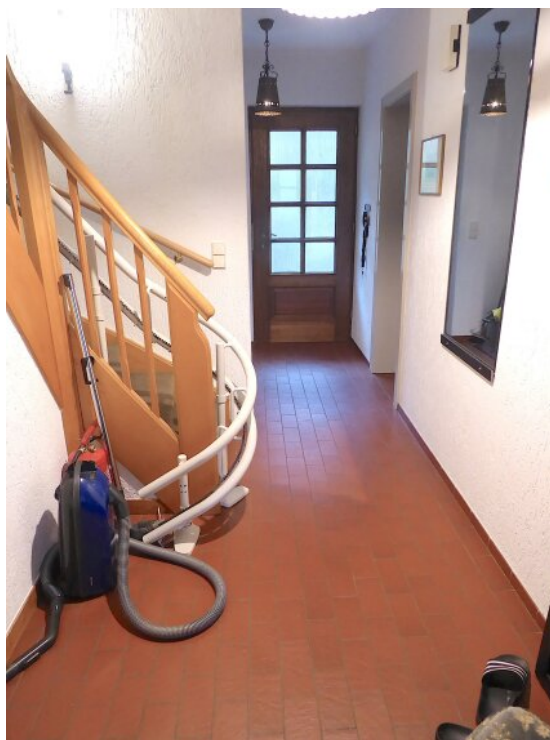
Flur mit Eingang EG