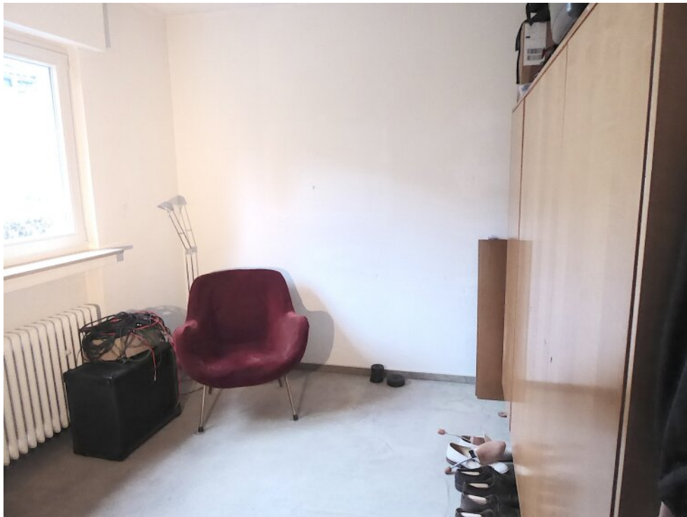
Kinderzimmer I OG