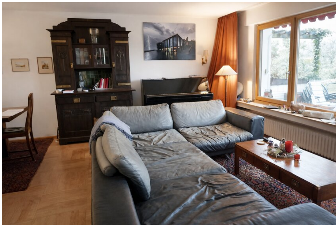
Wohnzimmer im EG