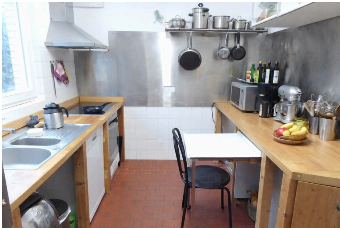
Bildschirmfoto 2026-01-02 um 19.38.35