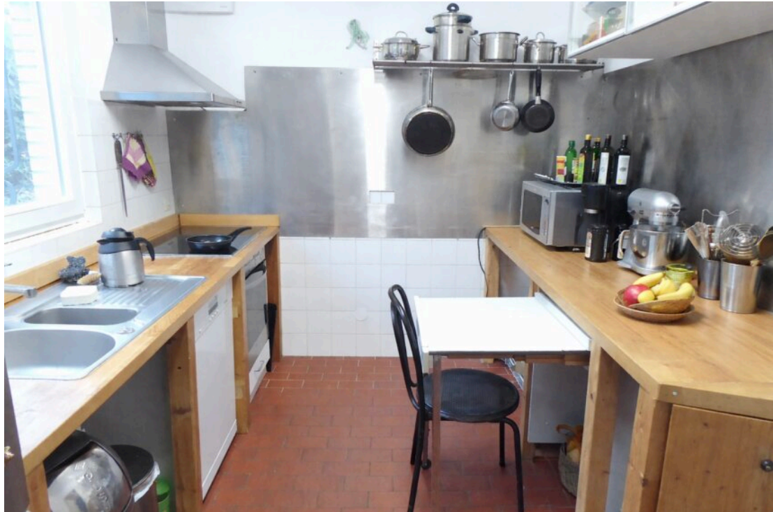
Bildschirmfoto 2026-01-02 um 19.38.35