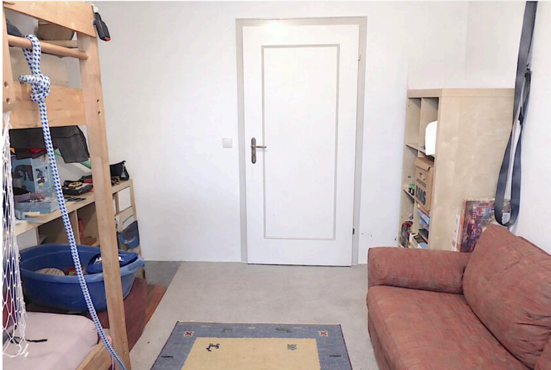
Kinderzimmer II im OG