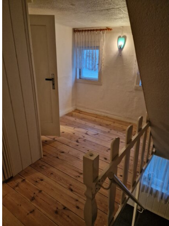
Flur 1. OG