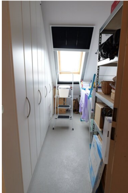
Abstellkammer im DG