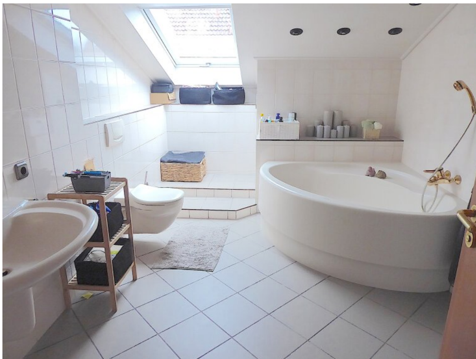
Tageslichtbad Wohnung hinten