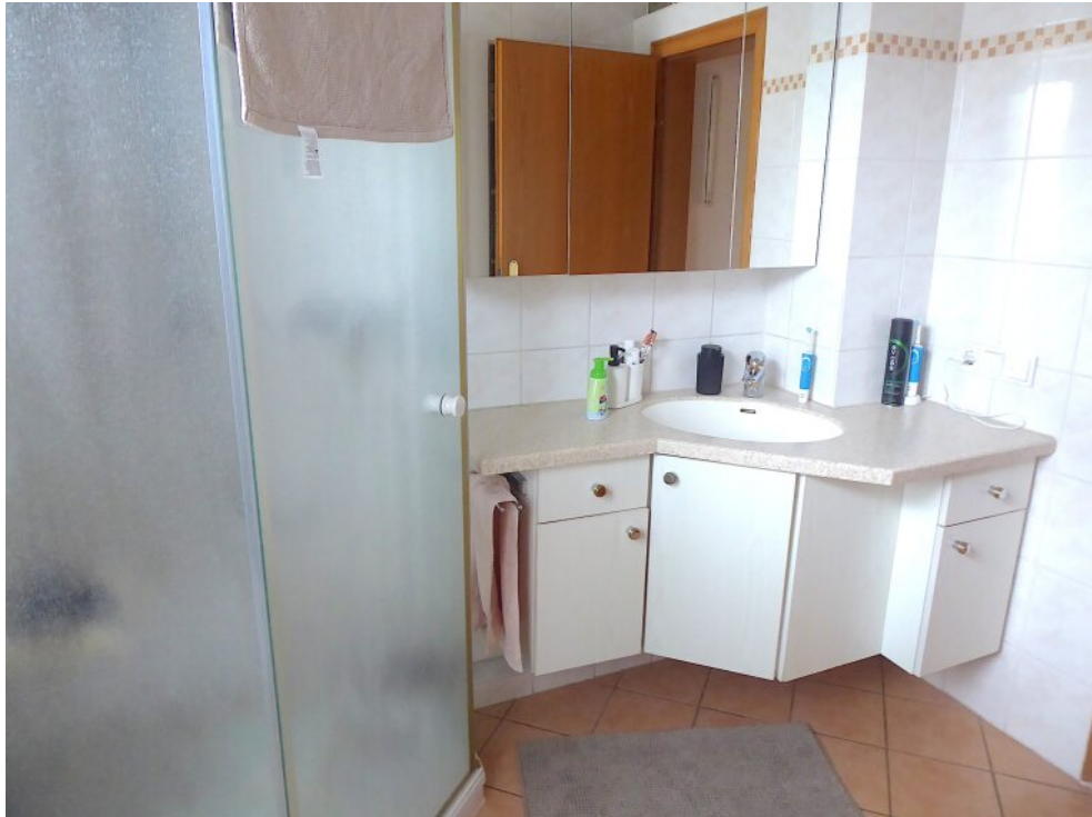
Tageslichtbad Wohnung vorne