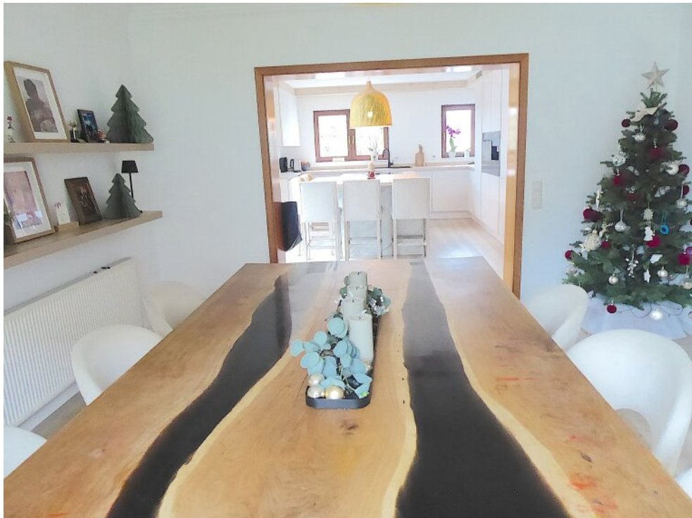
Essbereich und offene Küche Wohnung hinten