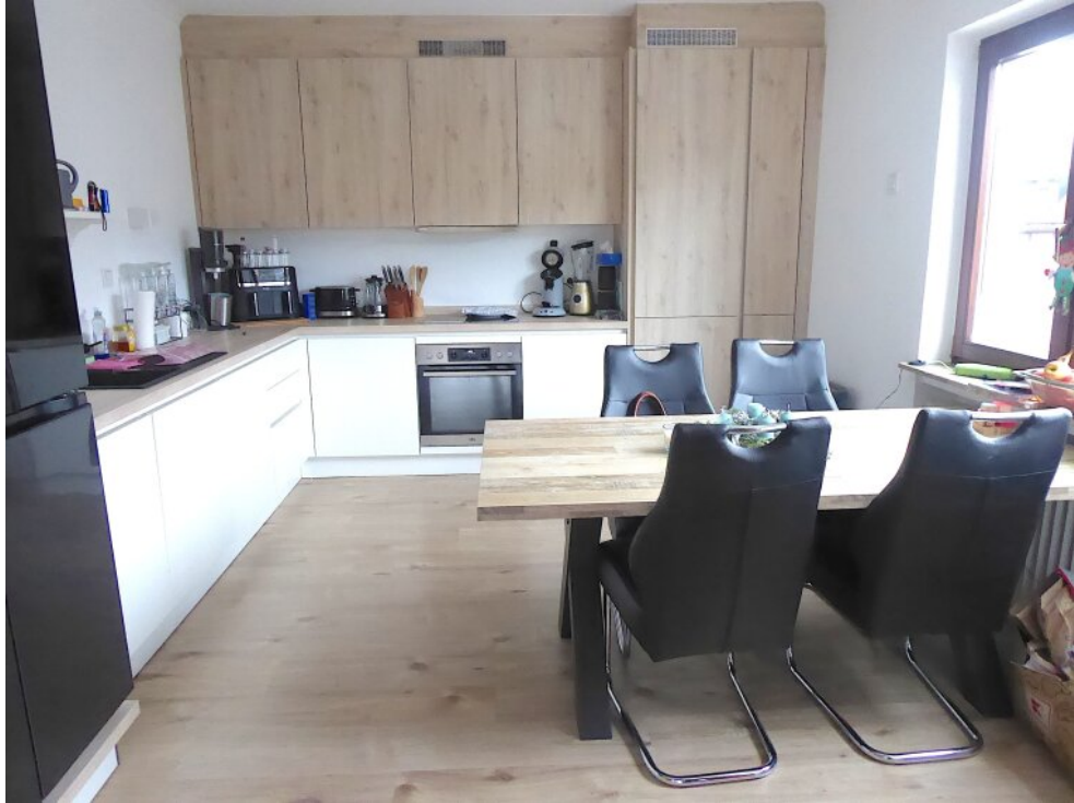
Küche Wohnung vorne