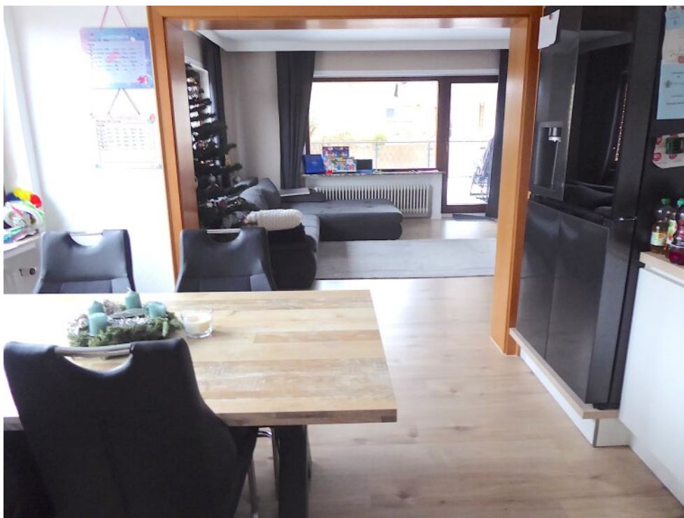
Küche und Wohnbereich Wohnung vorne