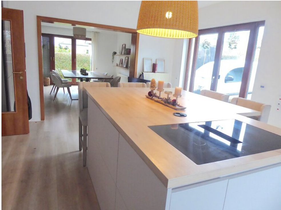
Offene Küche mit Essbereich hintere Wohnung