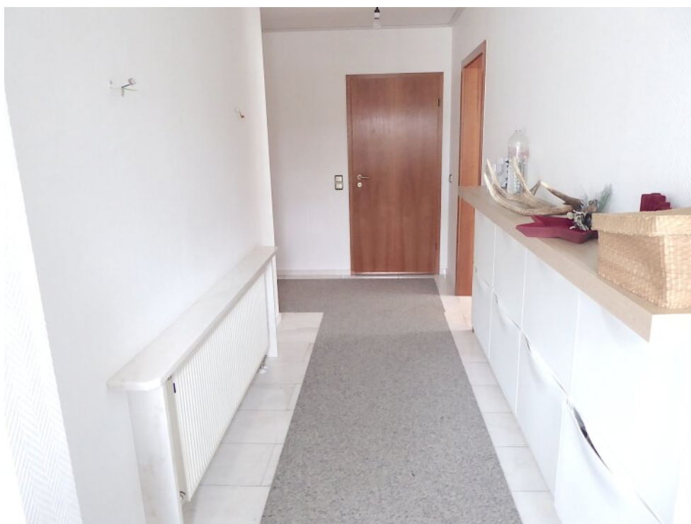
Eingangsflur Wohnung hinten