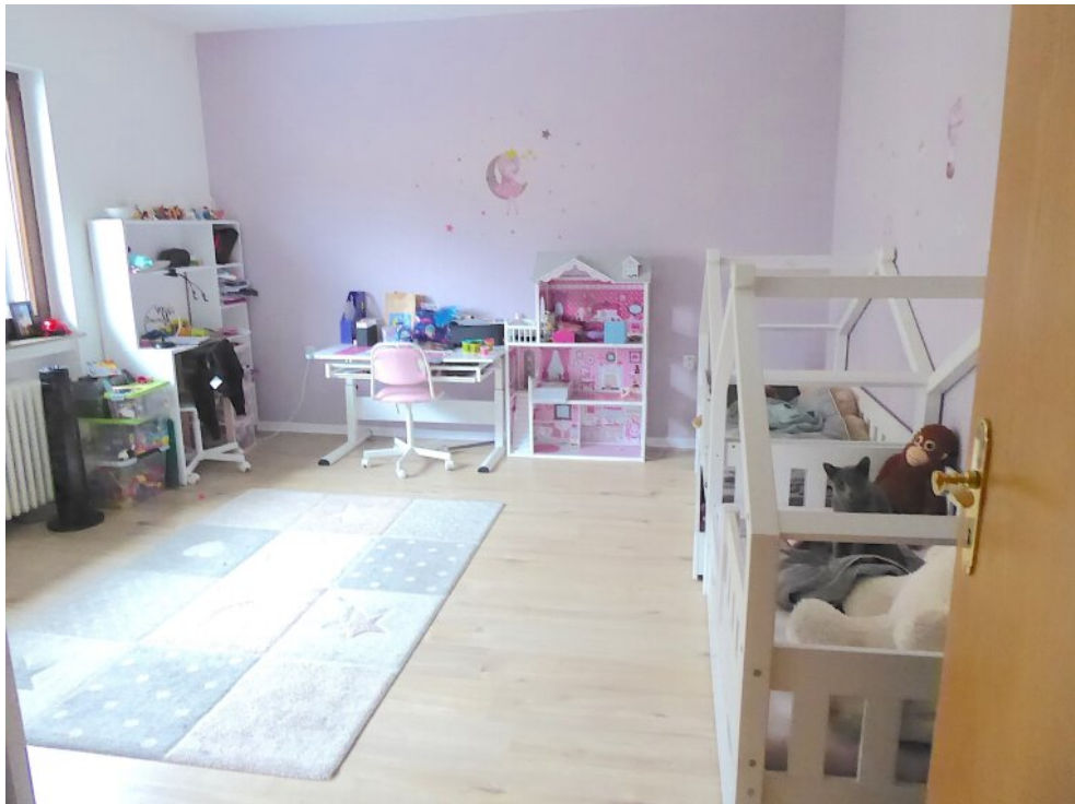
Kinderzimmer Wohnung vorne