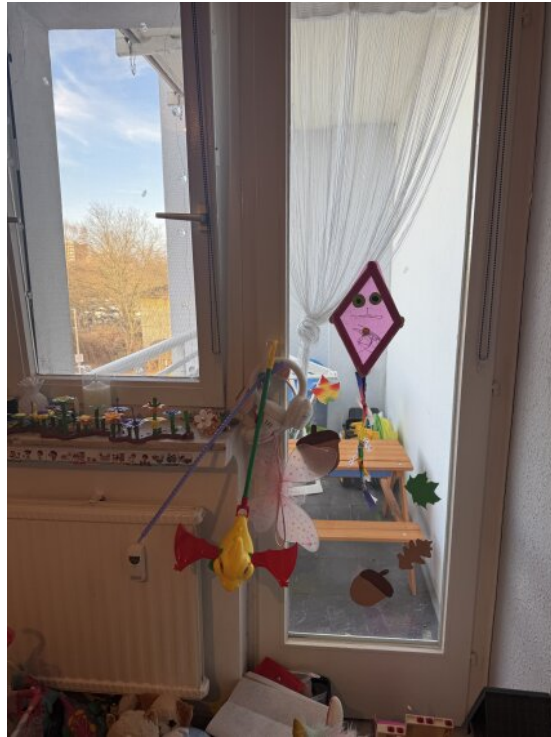
Kinderzimmer mit Balkon