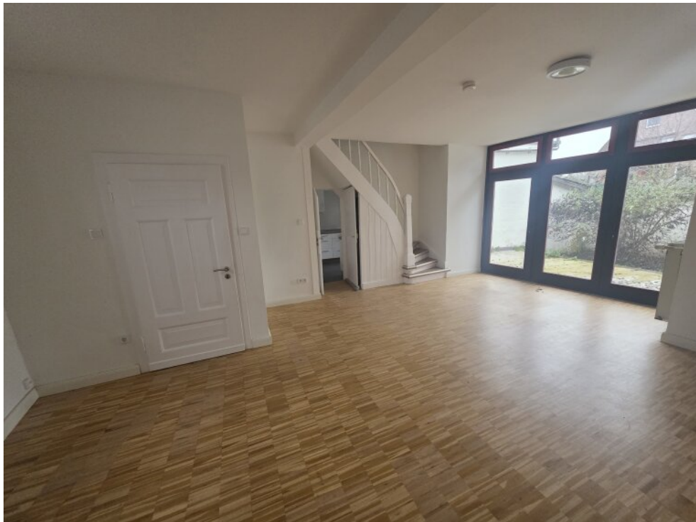
Wohnbereich mit Parkettboden