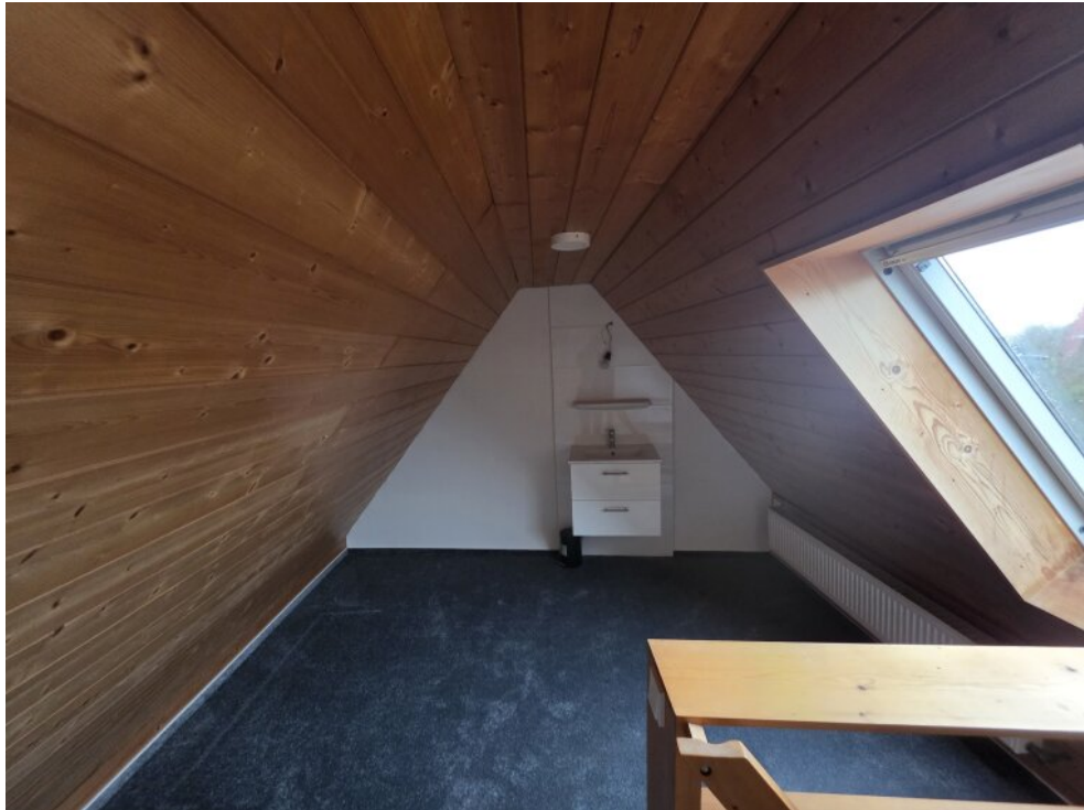
Dachboden Teil 2 von 2