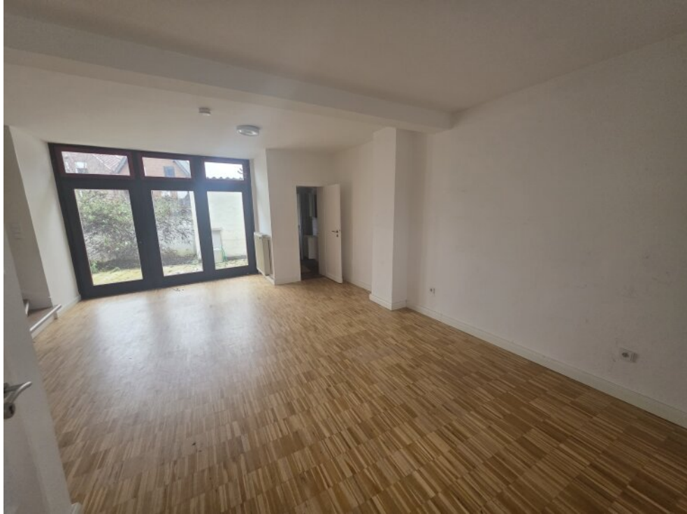
Wohnbereich mit Badezimmer EG