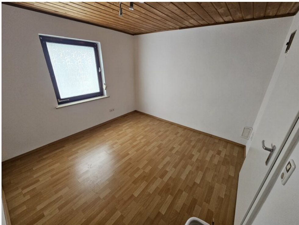
EG Schlafzimmer 2