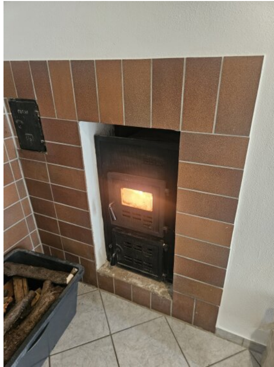
EG Heizung / Holzofen