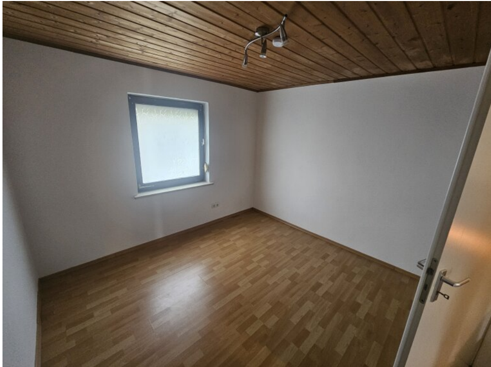
OG Schlafzimmer 1