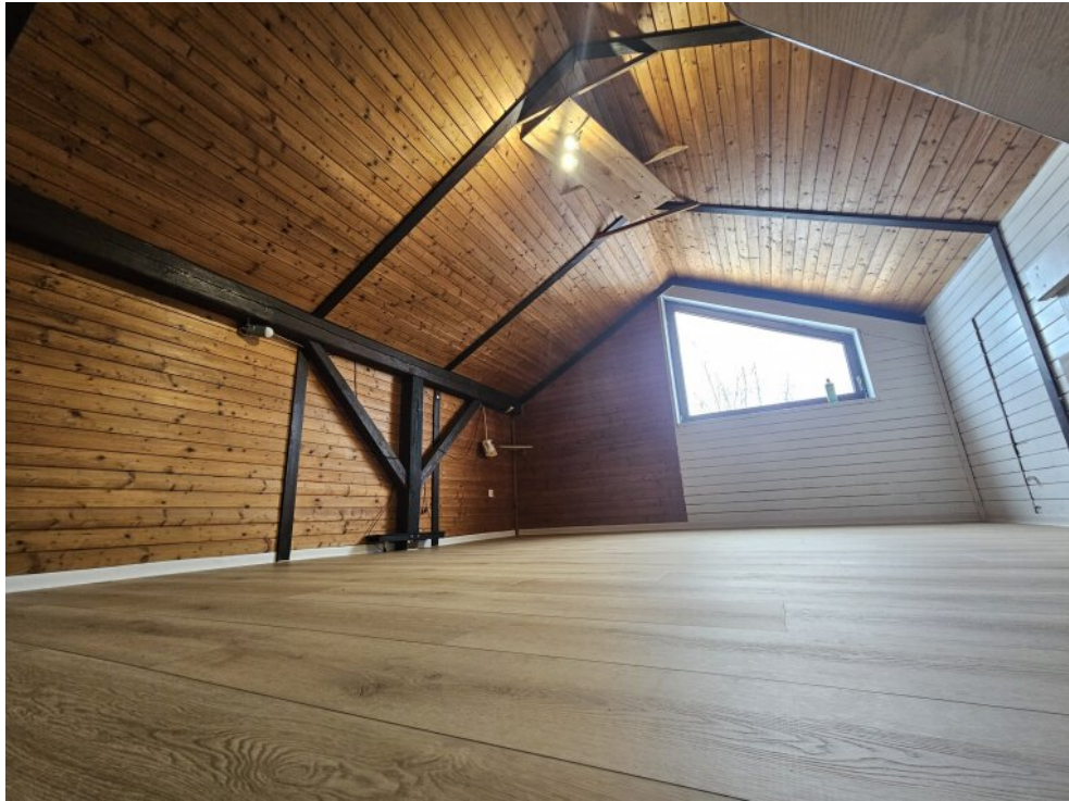
DG Zimmer 1