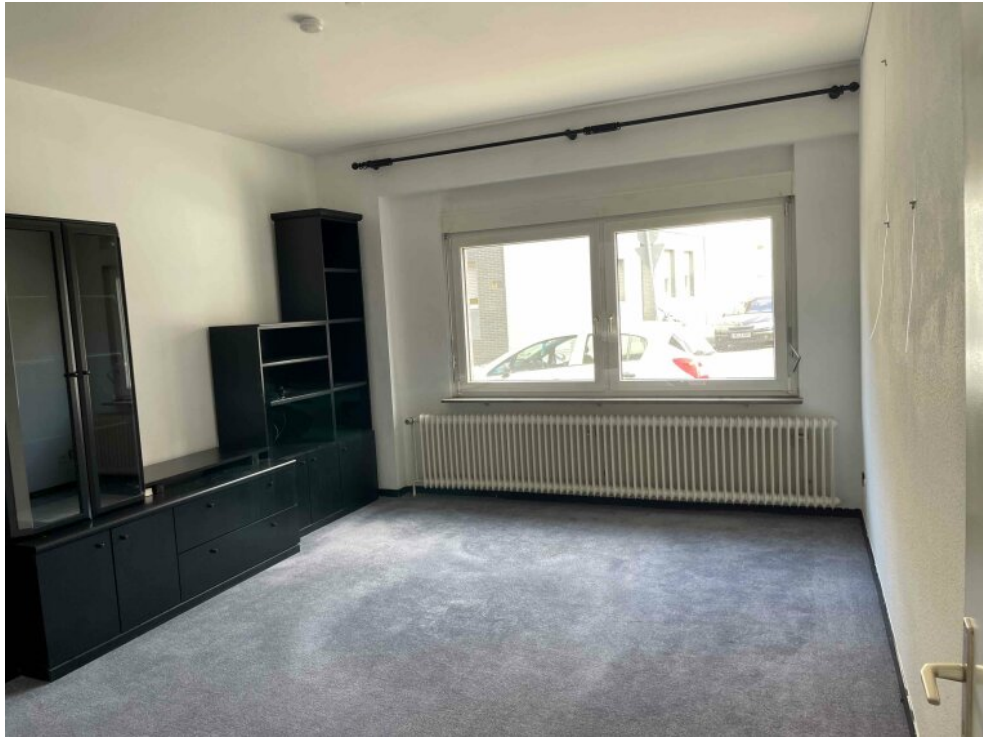
EG rechts Wohnzimmer