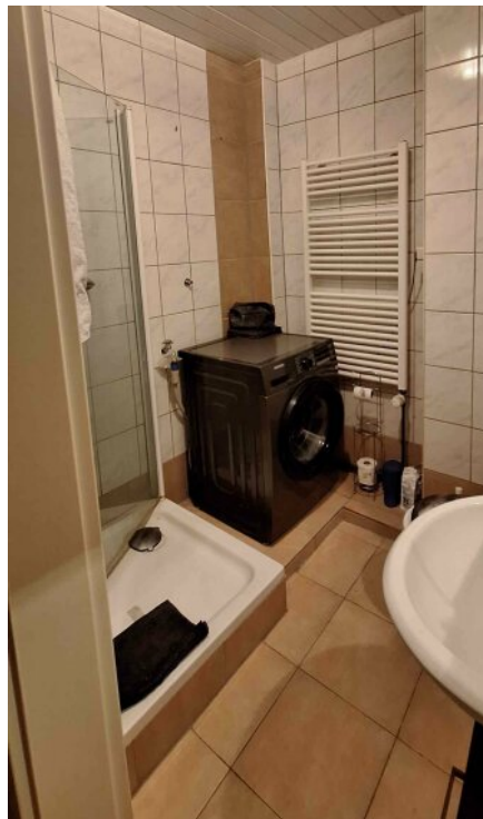
1.OG rechts Bad