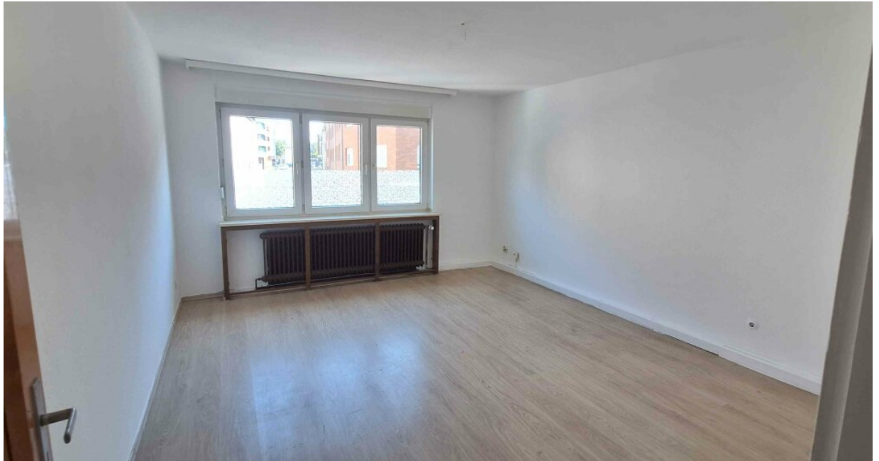
1.OG links Wohnzimmer