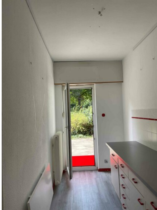
EG rechts Küche