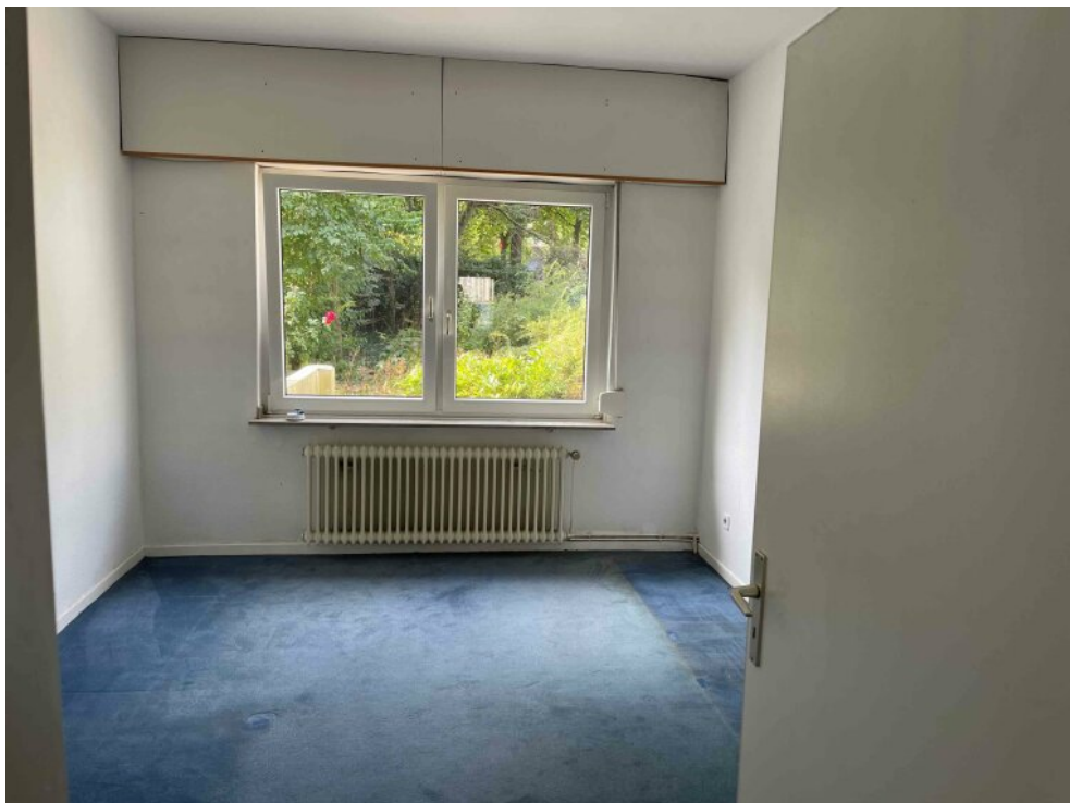
EG rechts Schlafzimmer