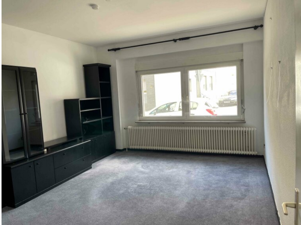
EG rechts Wohnzimmer