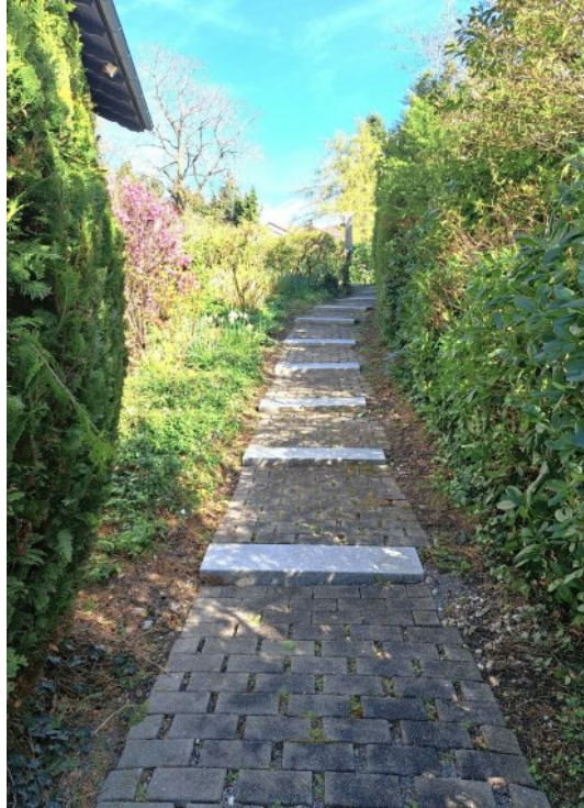
WhatsApp Image 2026-04-12 at 09.51.49