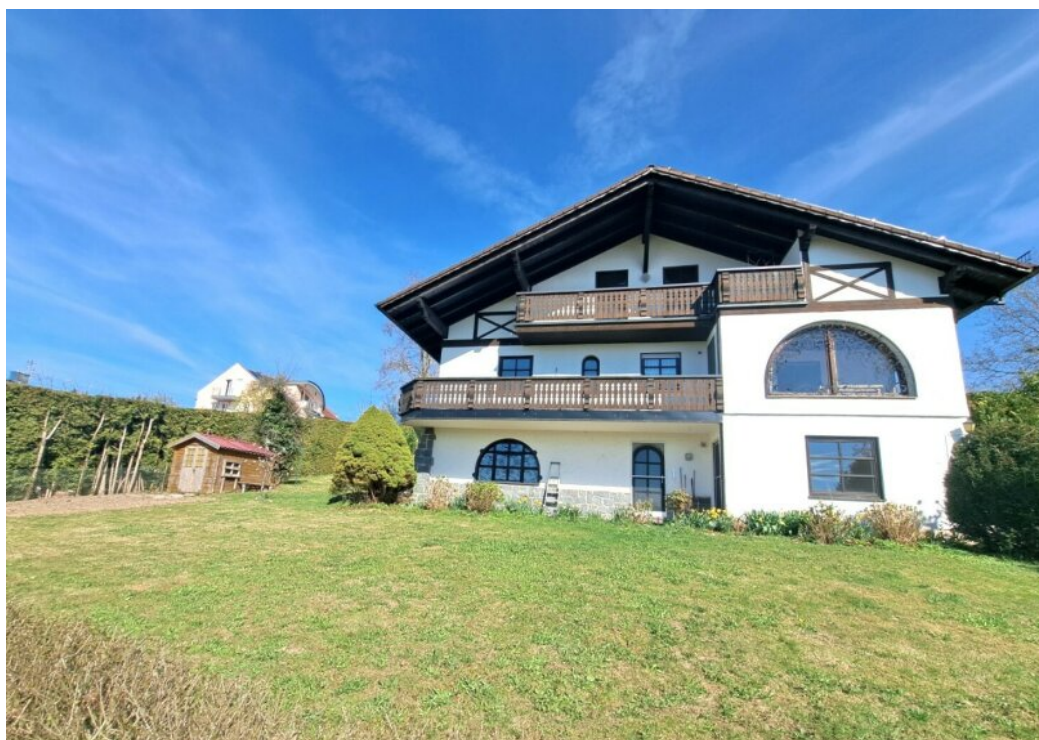
WhatsApp Image 2026-04-12 at 09.51.44 (1)