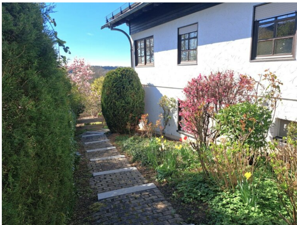
WhatsApp Image 2026-04-12 at 09.51.50 (1)