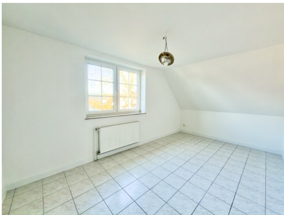
Zimmer 3 im OG