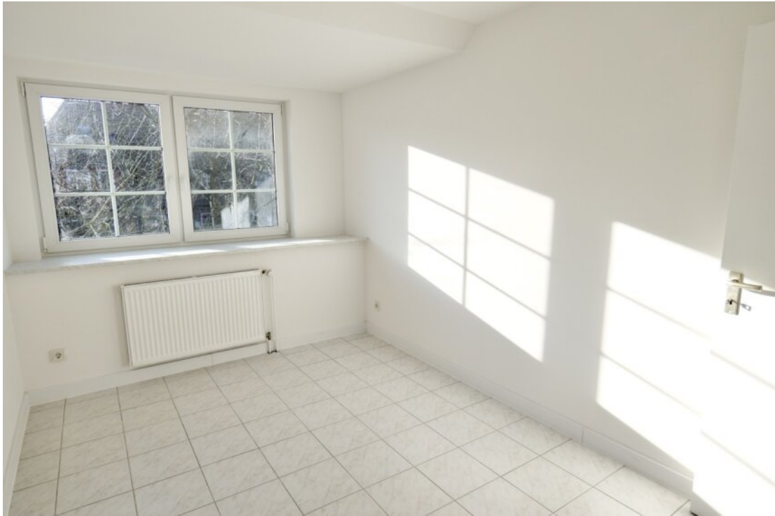
Zimmer 1 im OG