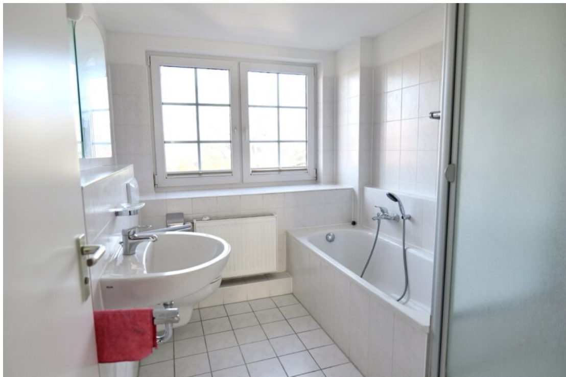
Bad mit Wanne + Dusche OG