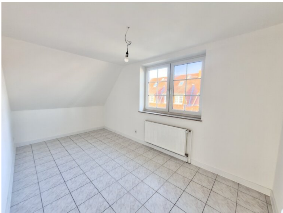
Zimmer 2 im OG