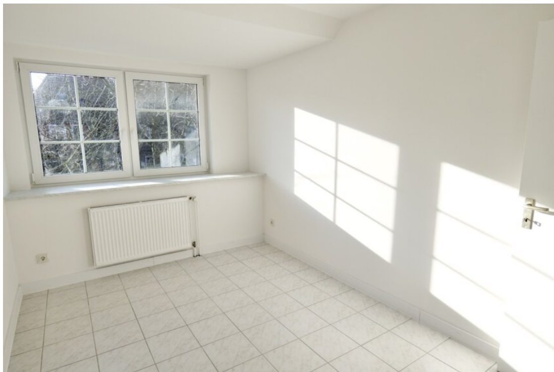
Zimmer 1 im OG