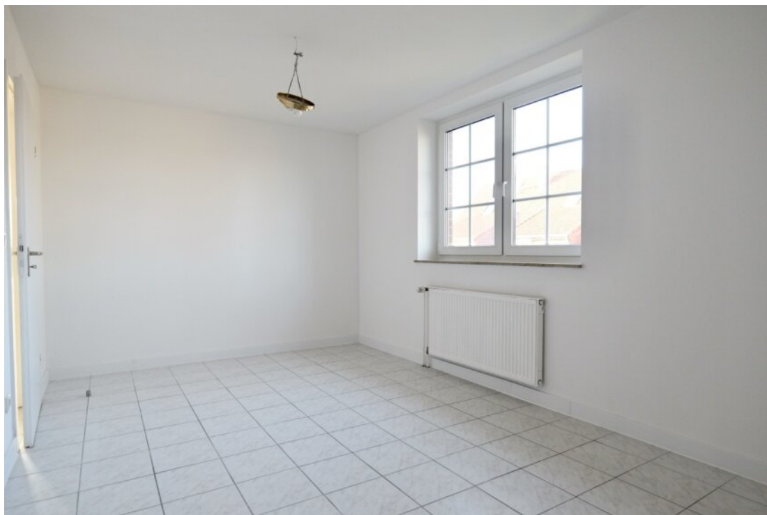
Zimmer 3 im OG