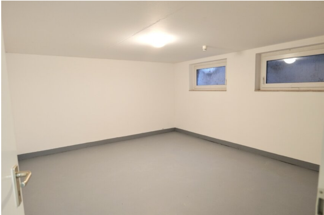
Keller Raum 2