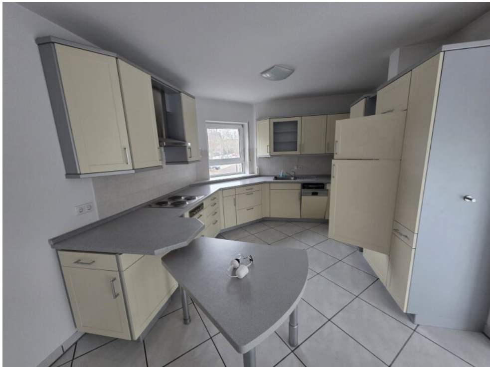
1. OG Küche