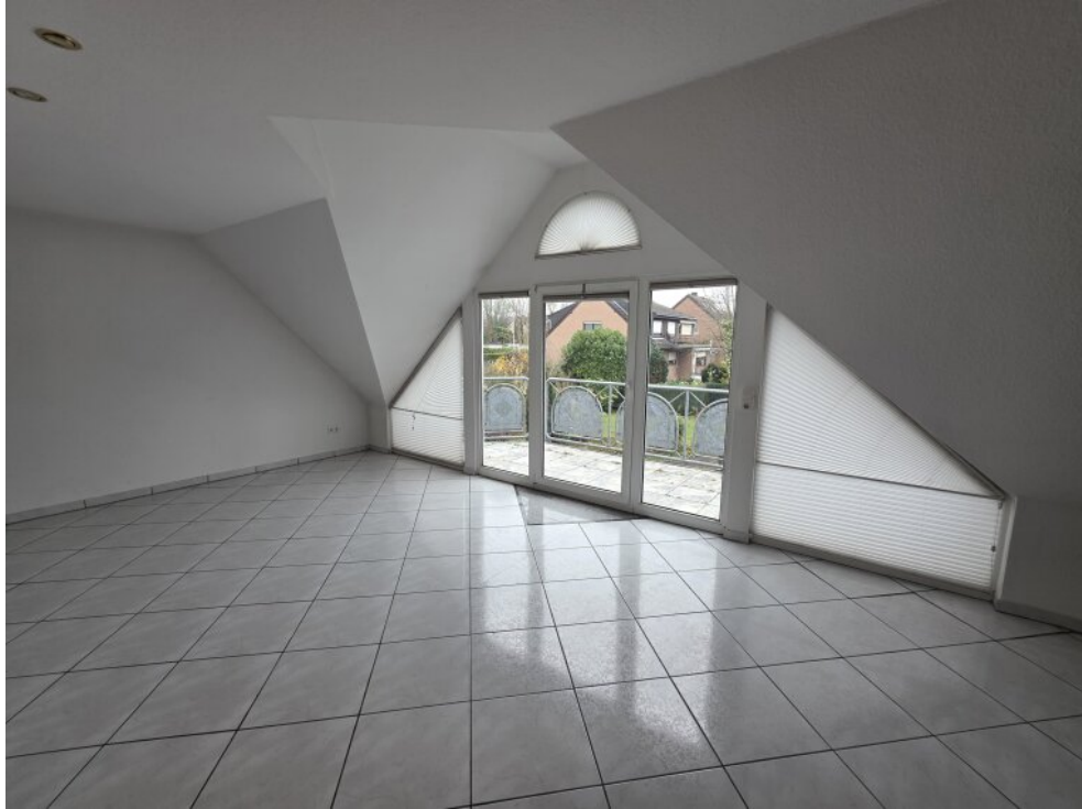
1. OG Wohnzimmer