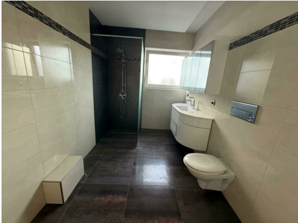
Bad 1 EG