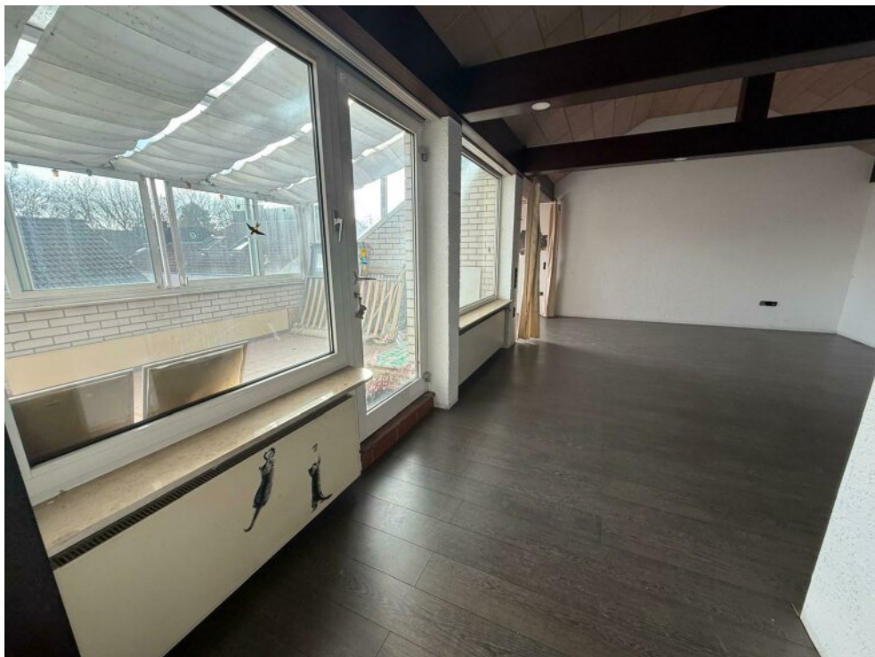
Wohnzimmer mit Wintergarten