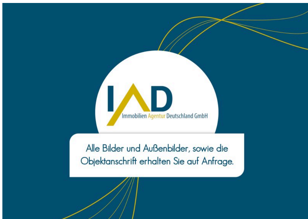
Bilder auf Anfrage