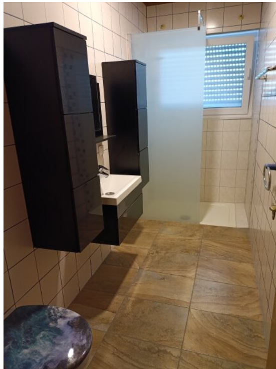
Bad 2 EG