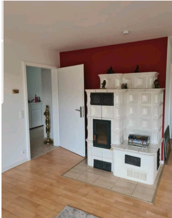
Kamin im Wohnzimmer