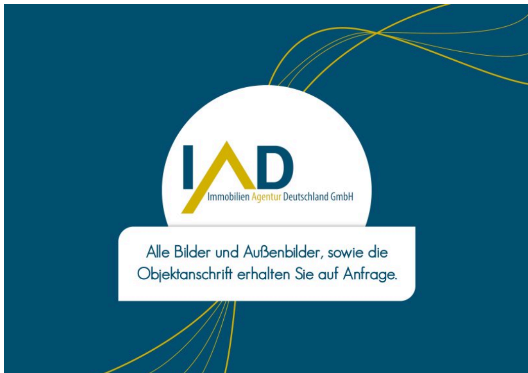
Bilder auf Anfrage