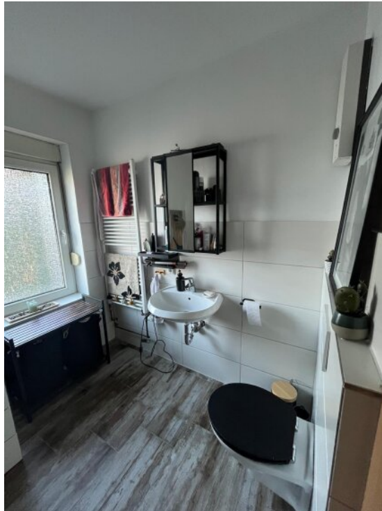
Bad 1. OG