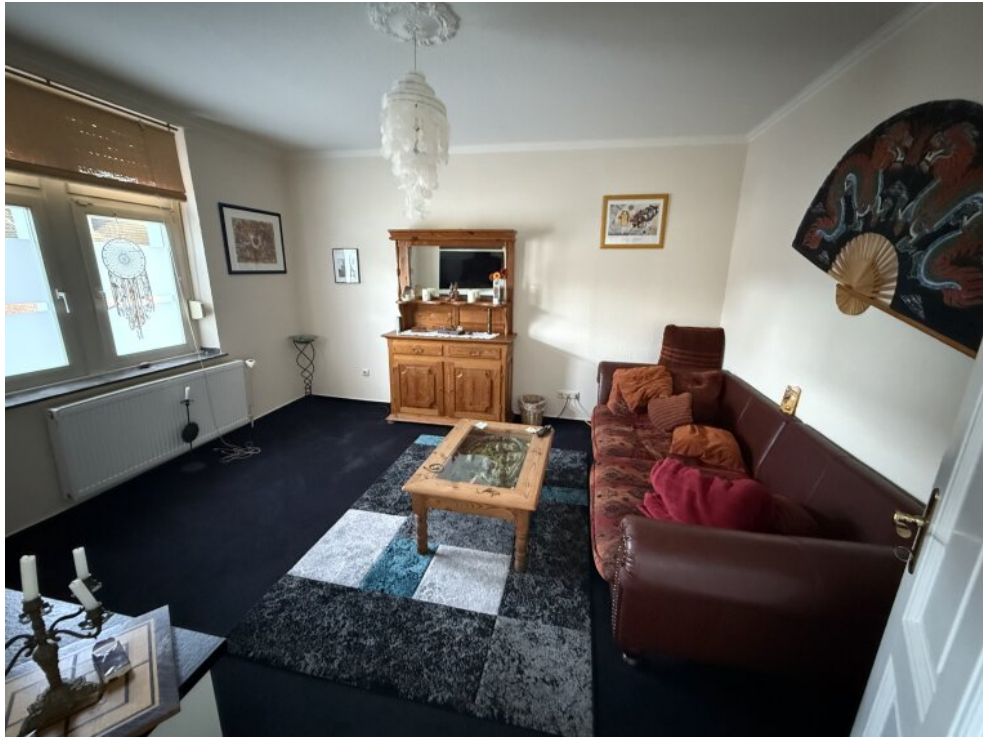
Zimmer im OG (WZ)