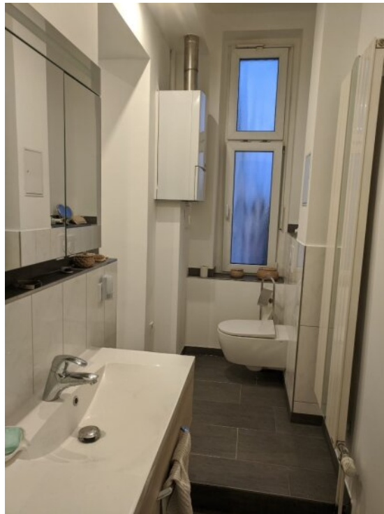
Bad mit Dusche und Fenster