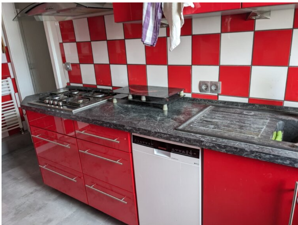
Große Einbauküche mit Fenster