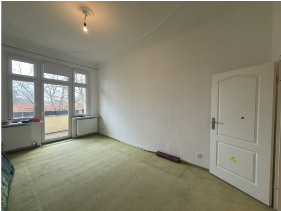
Kinderzimmer mit Balkon