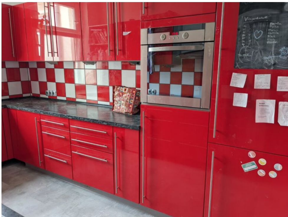
Große Einbauküche mit Fenster