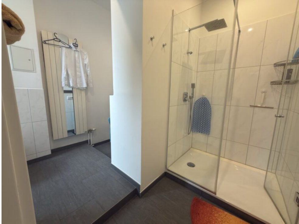
Bad mit Dusche und Fenster