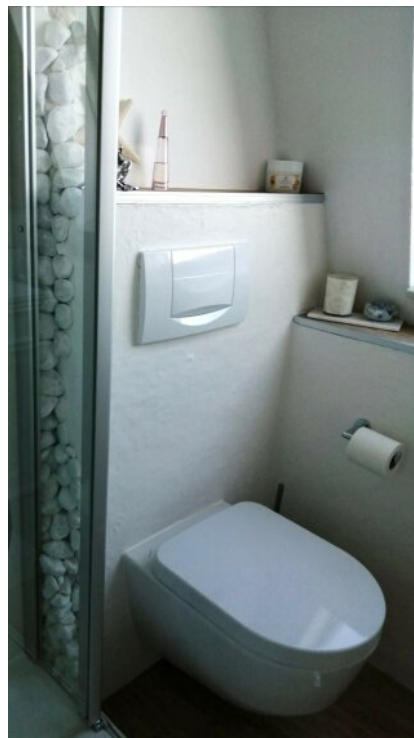
Badezimmer mit Dusche und WC