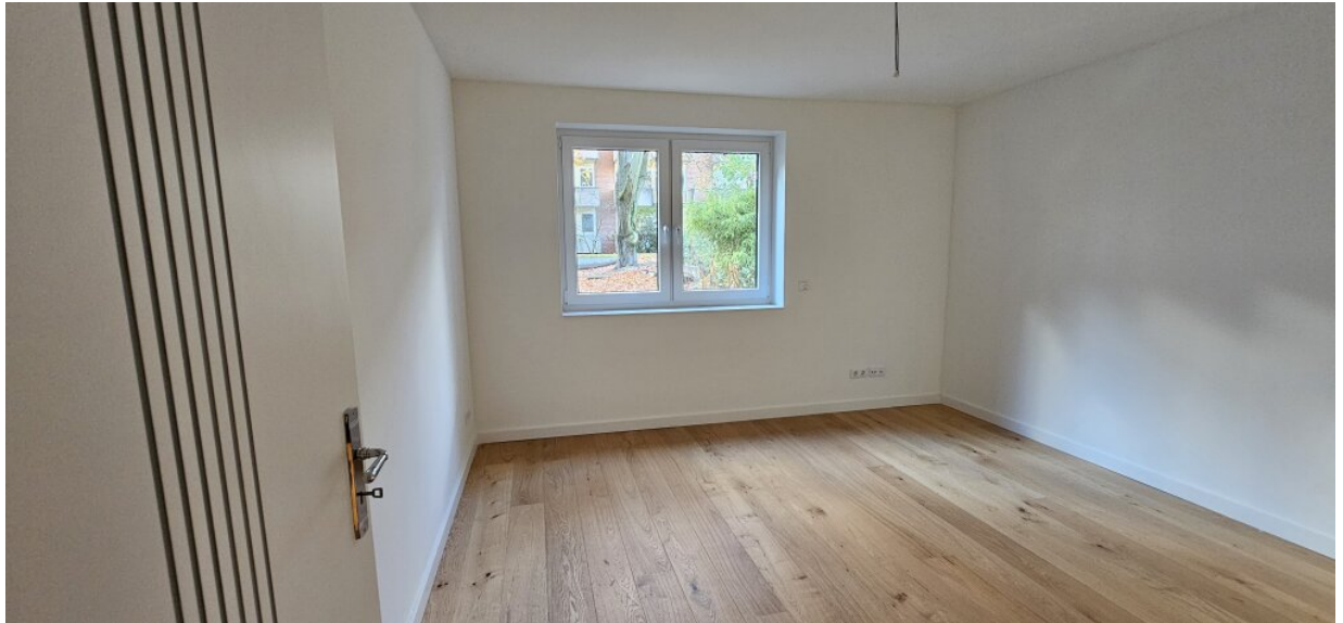
Wohnung EG Schlafzimmer