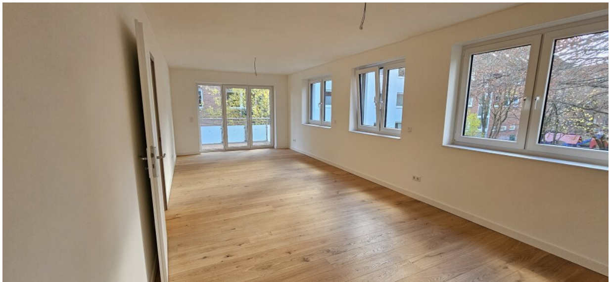
Wohnung OG Wohnzimmer