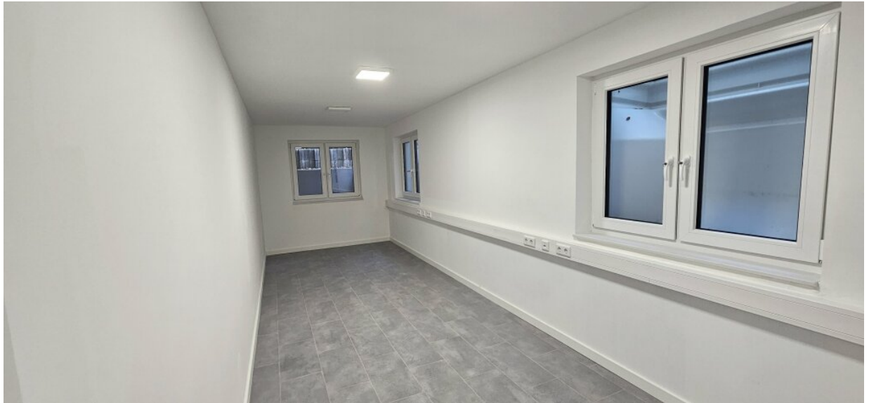
Keller Büro 1