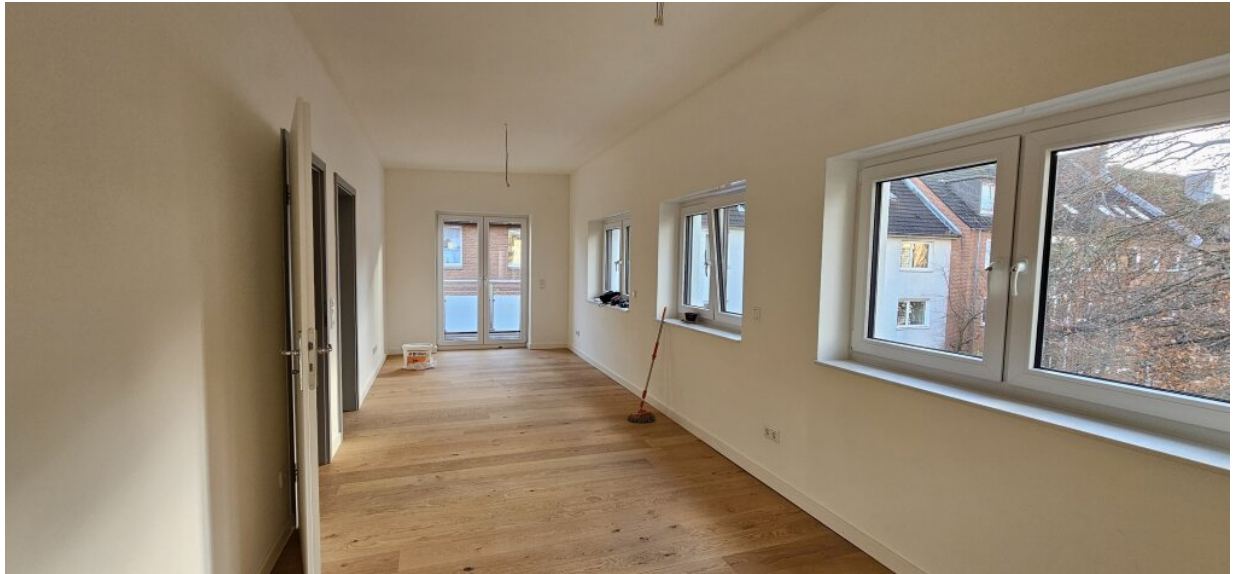
Wohnung DG Wohnzimmer