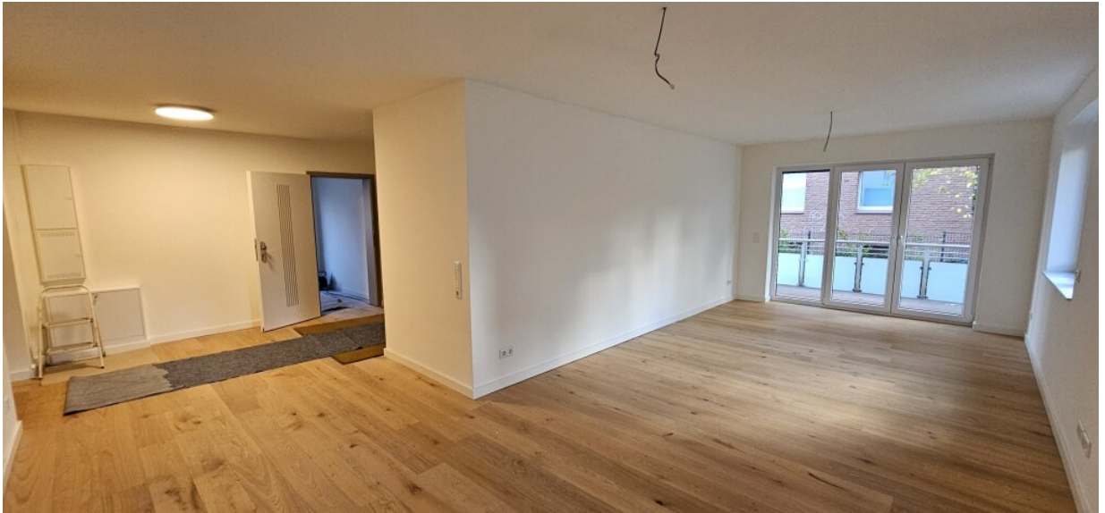
EG Wohnzimmer, Flur