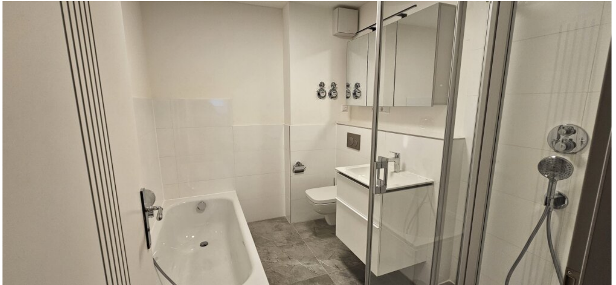
Wohnung OG Bad Wohnung