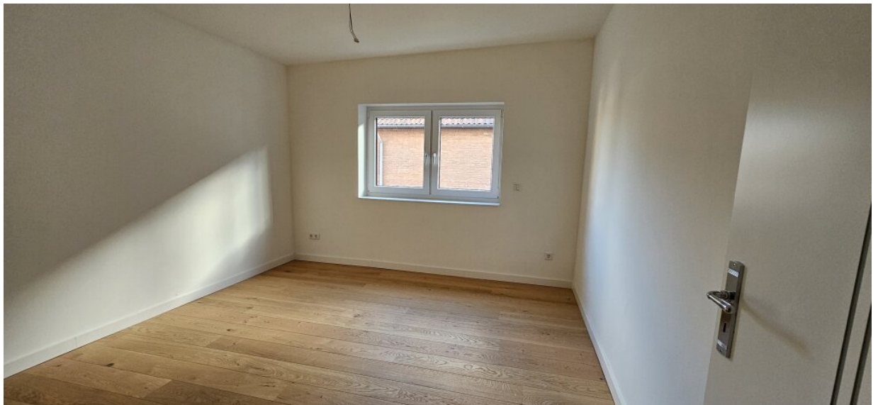
Wohnung DG Schlafzimmer