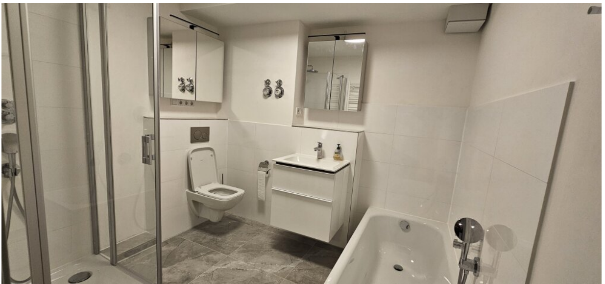
Wohnung EG Badezimmer