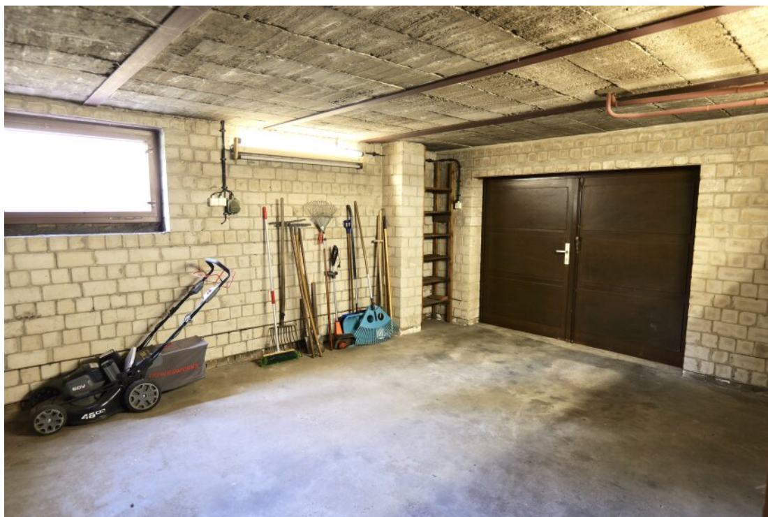
Garage im UG