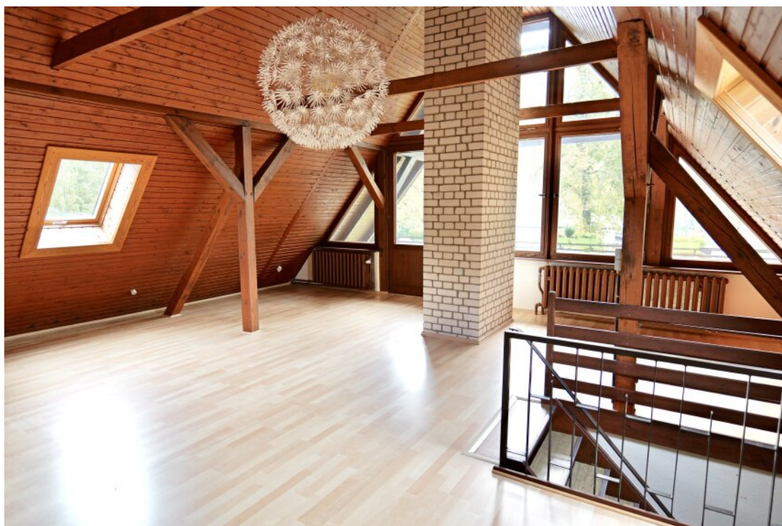
Das Atelier im OG