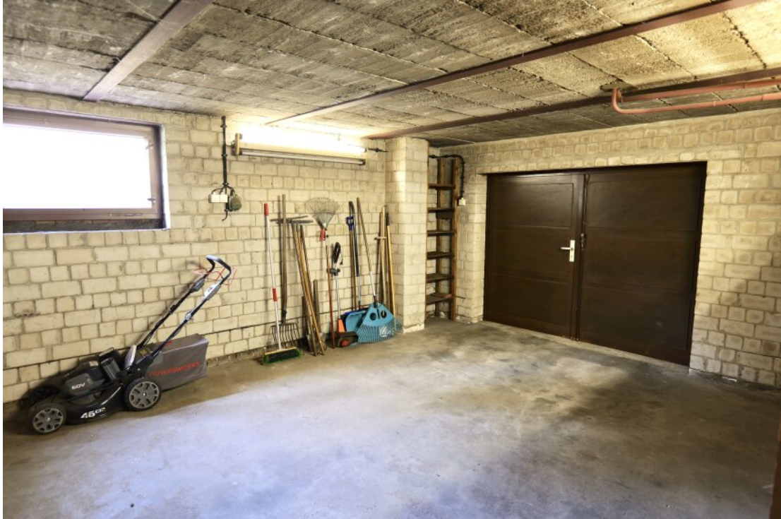
Garage im UG