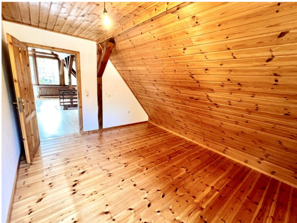
zweites Schlafzimmer im OG