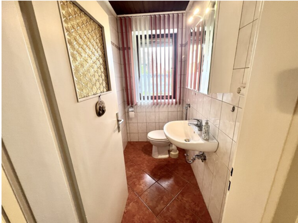
Gäste WC im EG