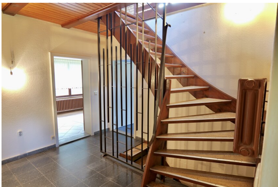
Treppe zum Atelier und Keller