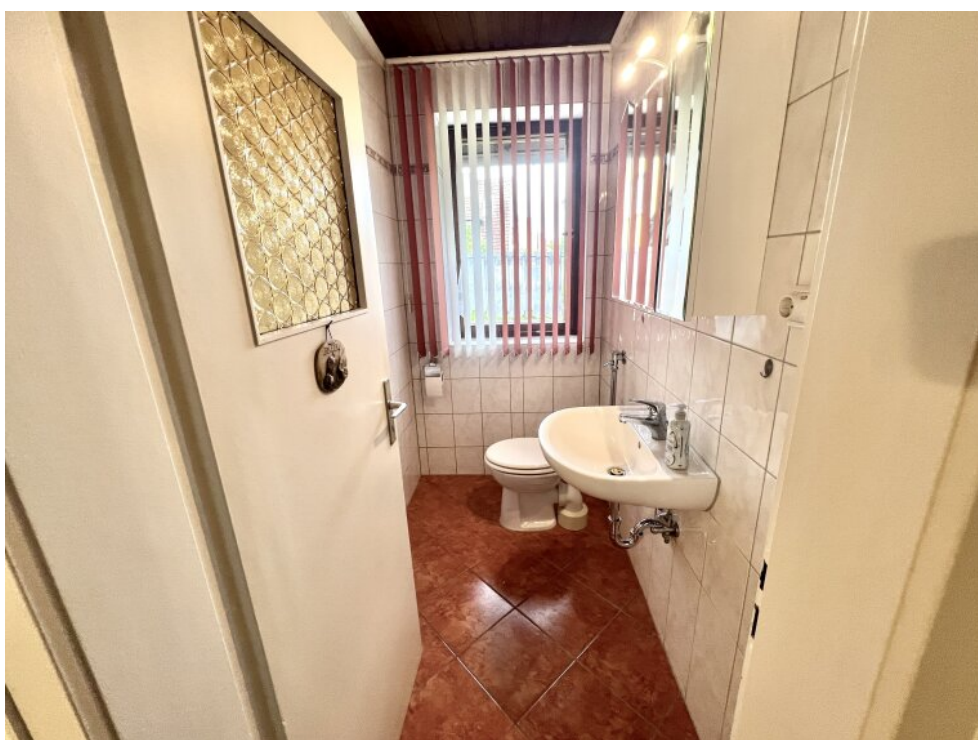
Gäste WC im EG