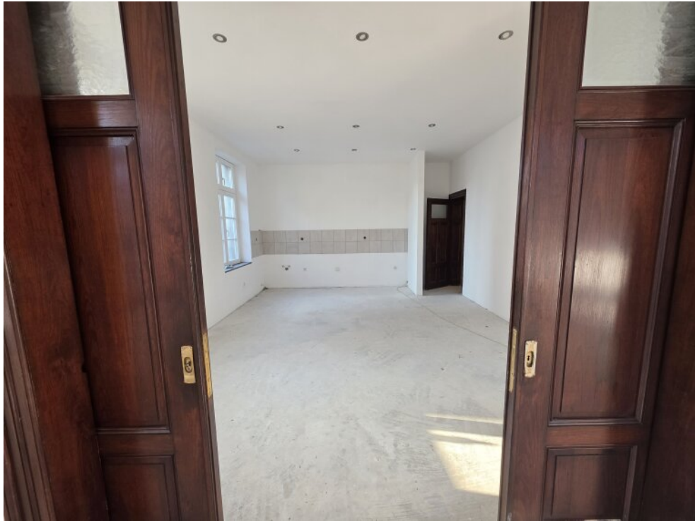
Sicht vom Wohnbereich