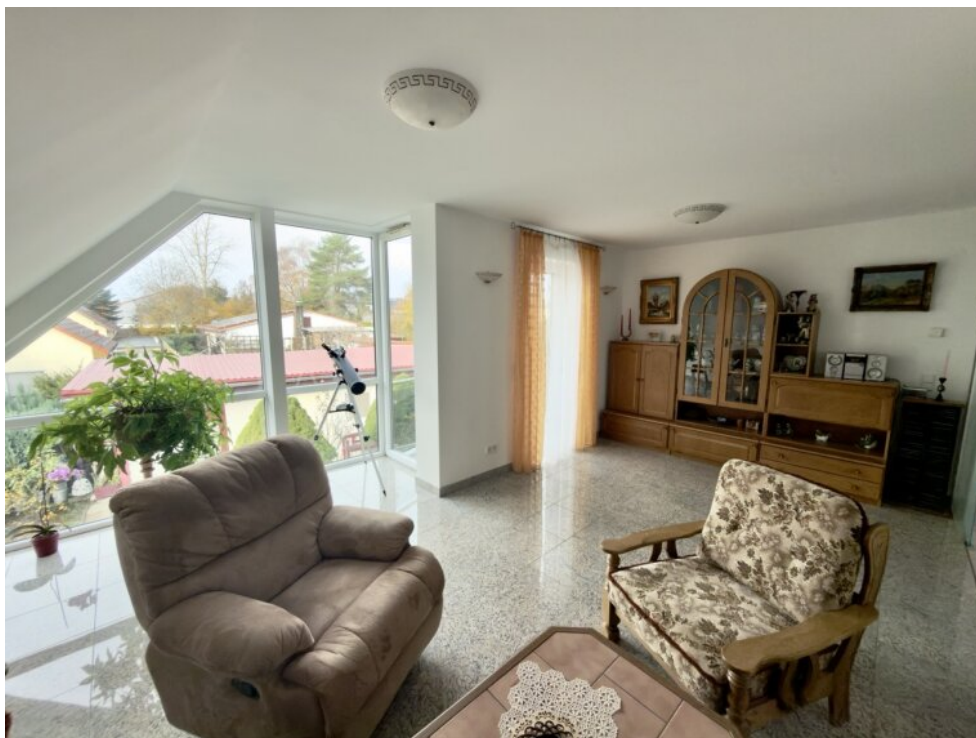
Wohnen mit Fensterfronten OG