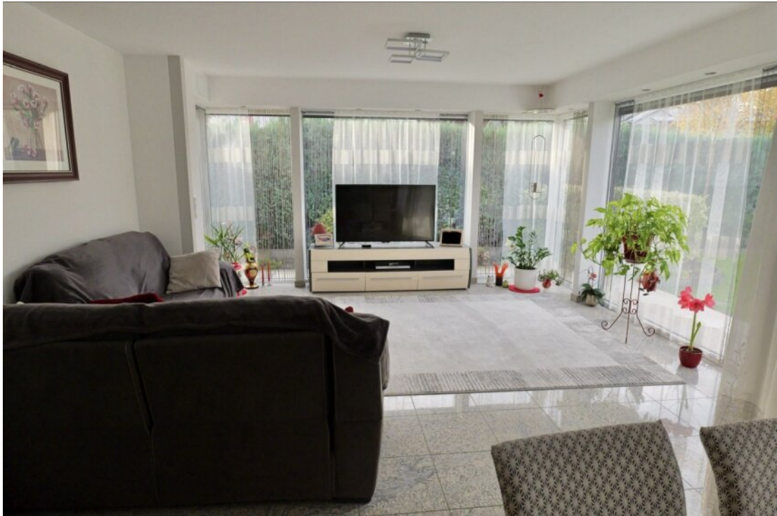
Wohnen mit Fensterfronten EG