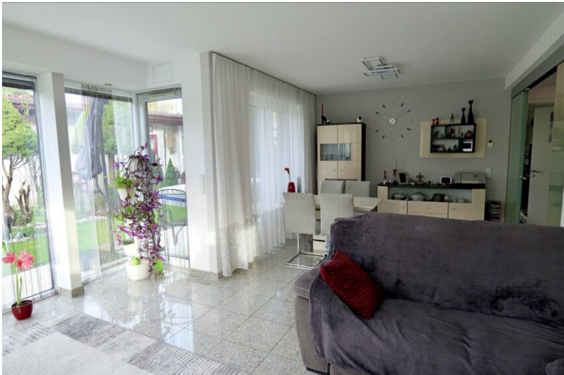
Wohnen mit Fensterfronten EG