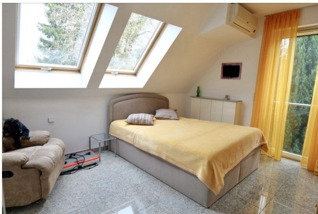
Schlafen 1. OG