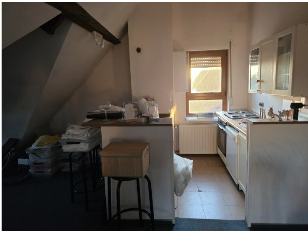
ausgebauter Dach (Einbauküche)