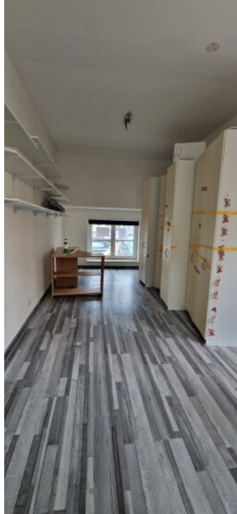
Praxis / 2. Wohnung