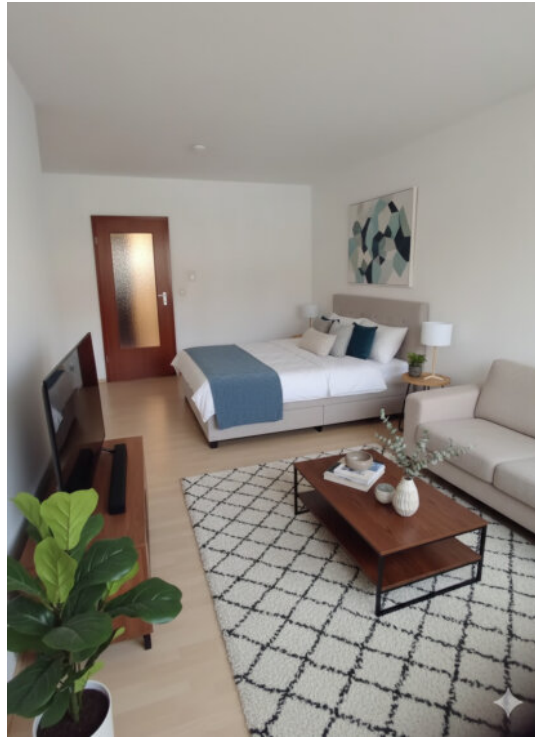
KI - Musterbild 2