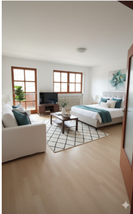
KI - Musterbild