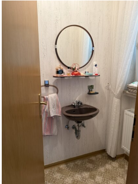
Gäste WC Erdgeschoss