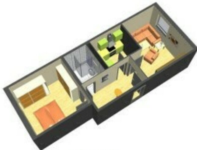
Grundriß 3 D