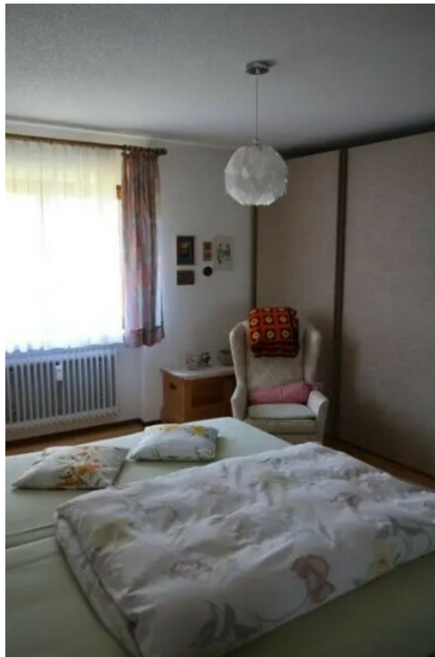
Schlafzimmer weiterer Aus