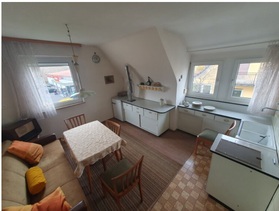
Küche 1 Stock