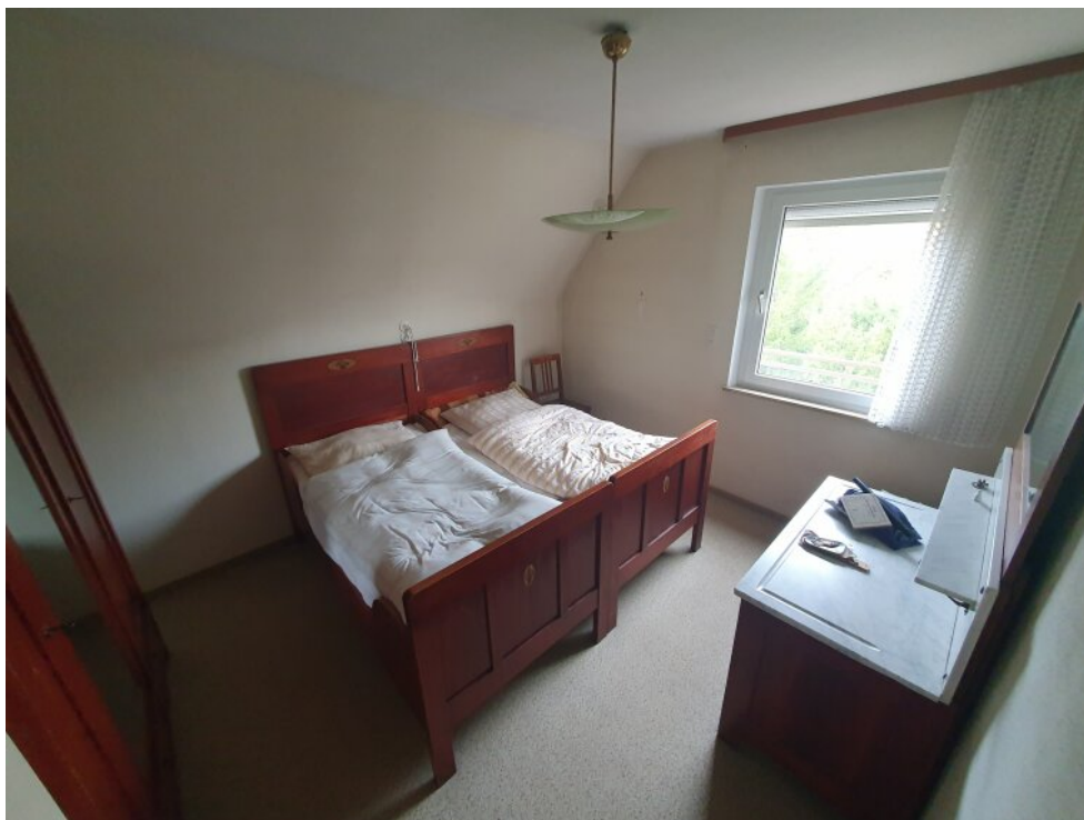
Schlafzimmer 1 Stock