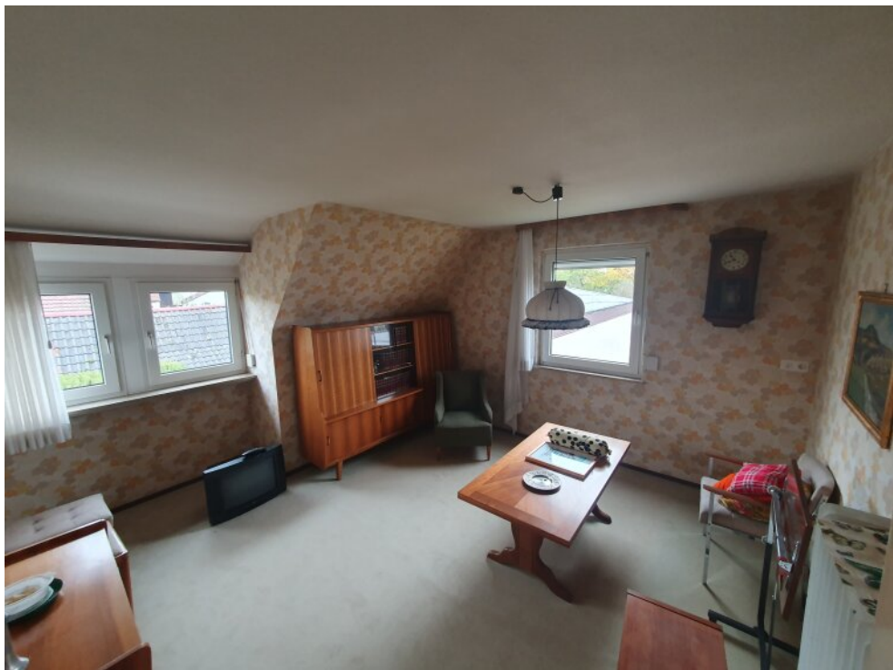
Wohnzimmer 1 Stock