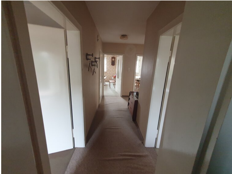
Flur 1 Stock