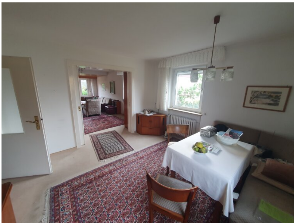
Esszimmer / Wohnzimmer