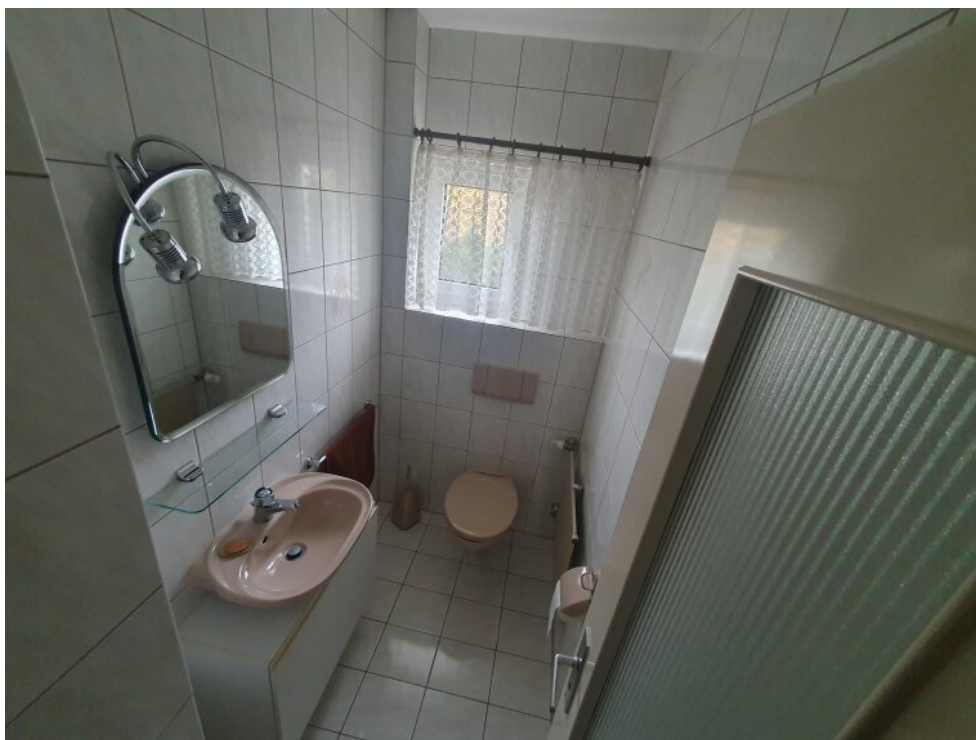
WC 1 Stock