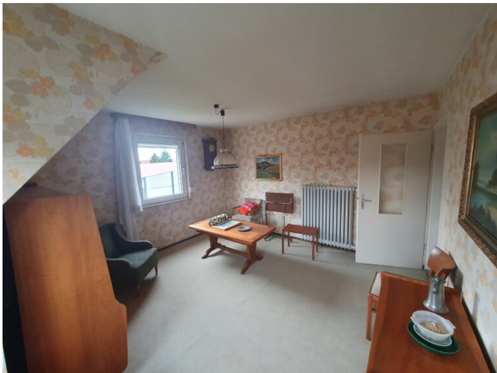
Wohnzimmer 1 Stock