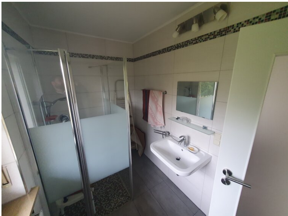
Dusche / WC