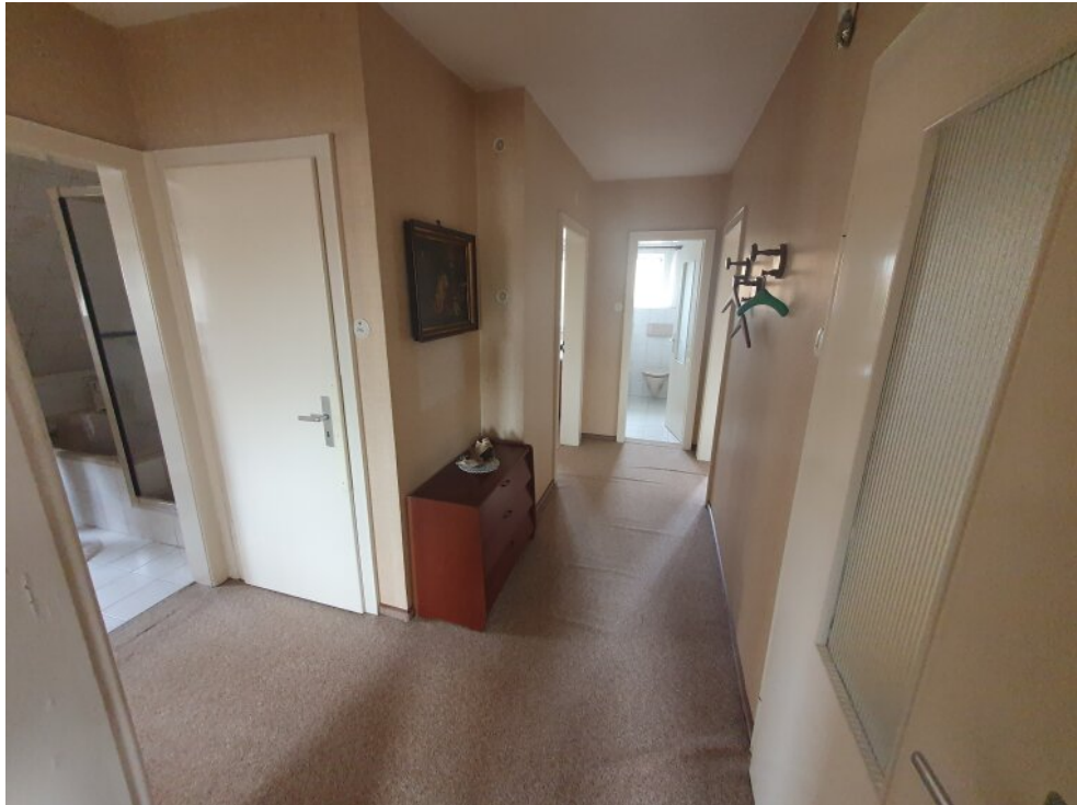
Flur 1 Stock