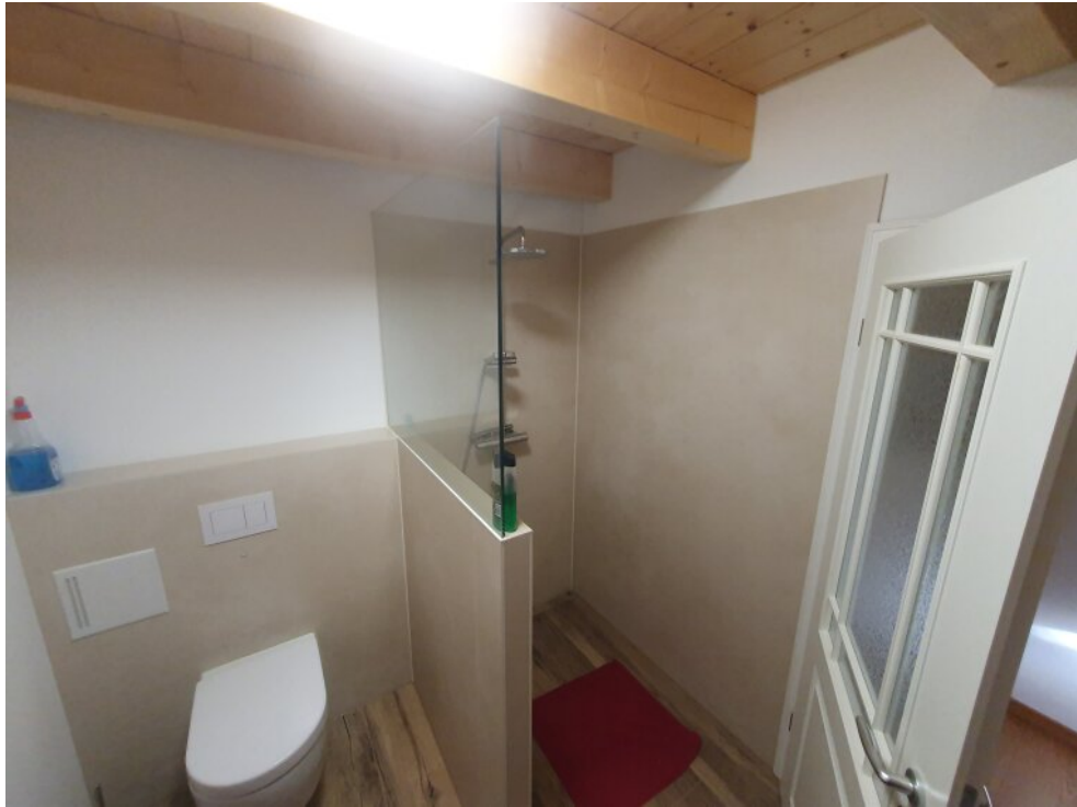
Bad / WC / UG