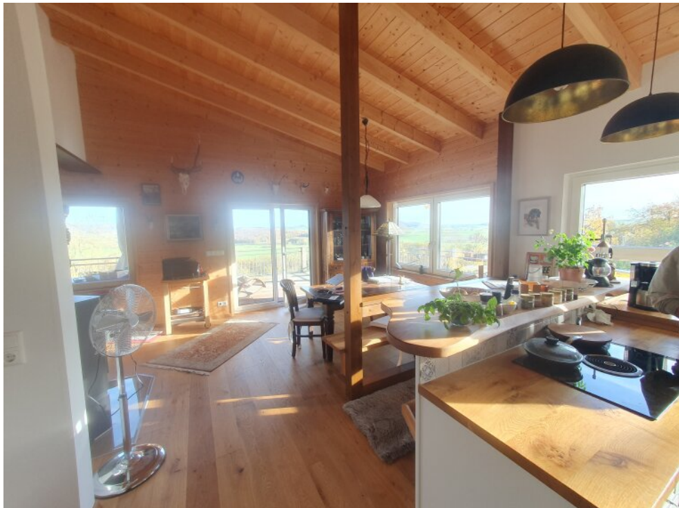
Wohnzimmer / Küche