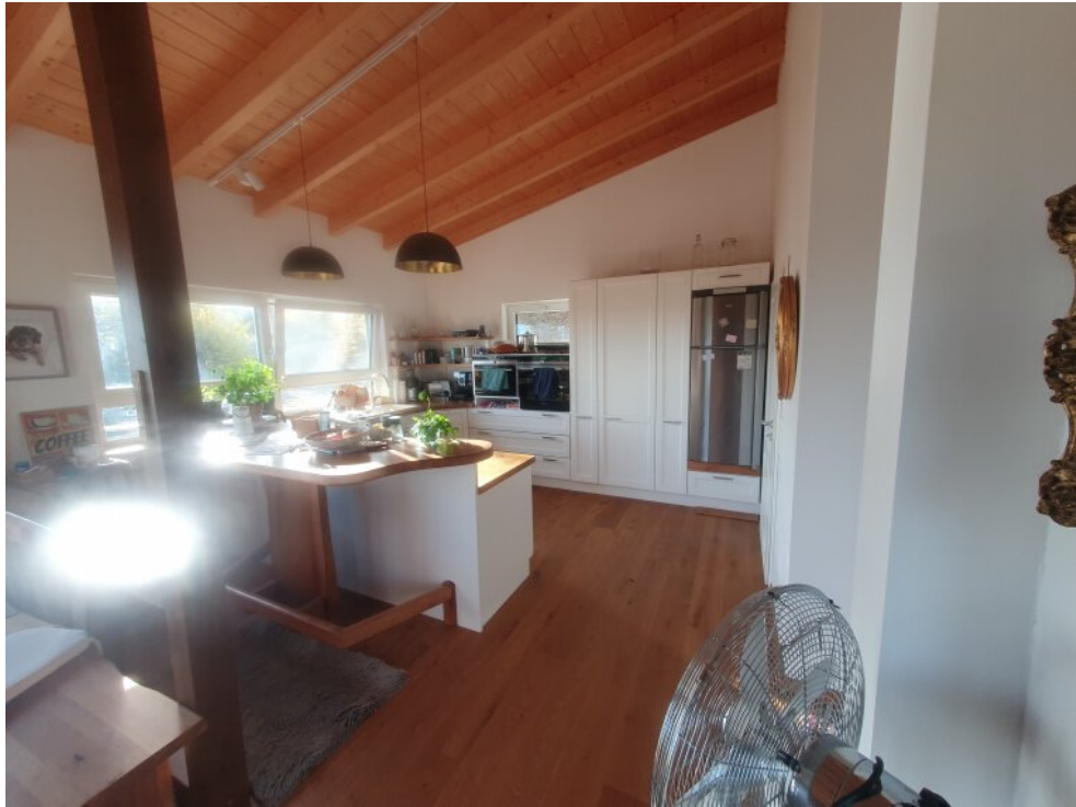
Wohnzimmer / Küche