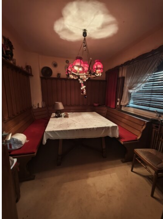
Jägerstube beim Essbereich