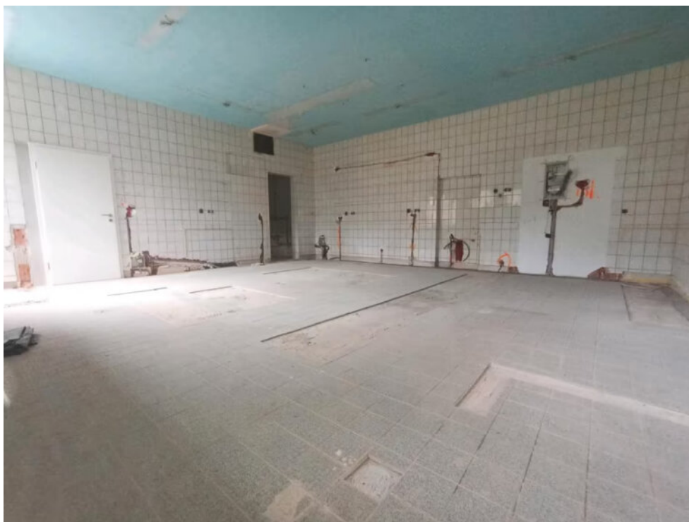
Küche / Wohnraum