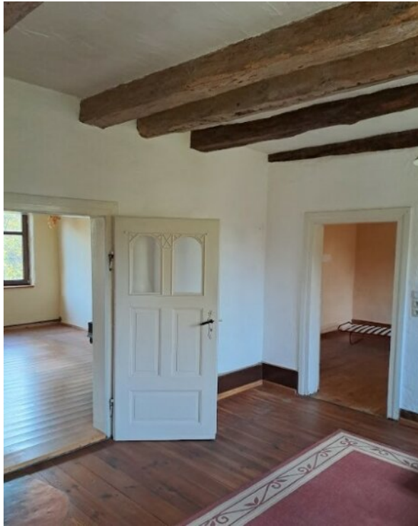
Blick in das EG