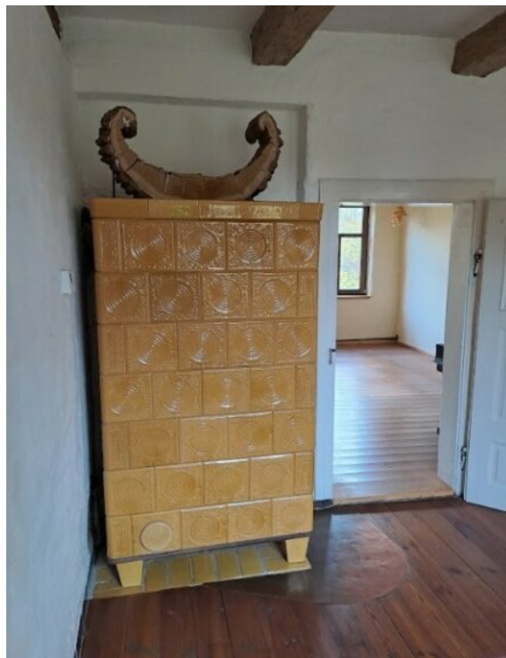
Kachelofen im EG