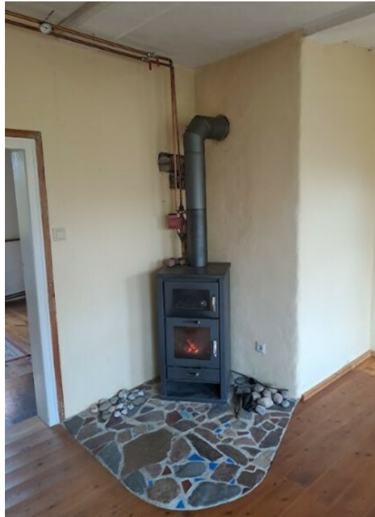
Ofen im EG