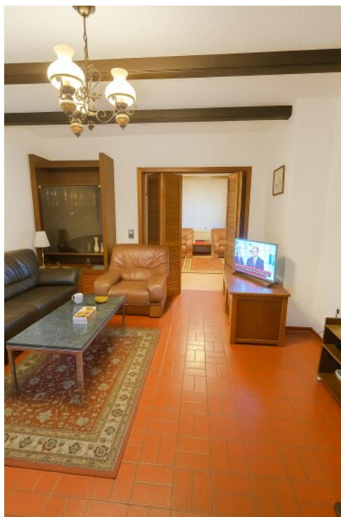
Lebensraum verteilt auf 2 Zimmer