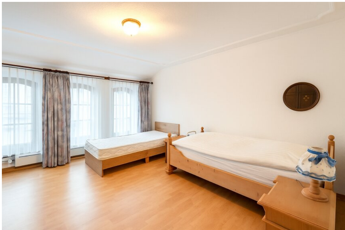
OG Schlafzimmer 1