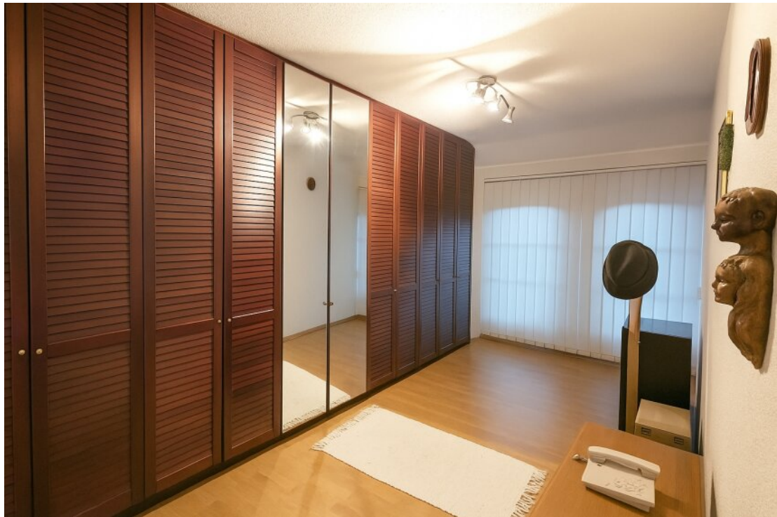
OG Ankleide- oder Kinderzimmer