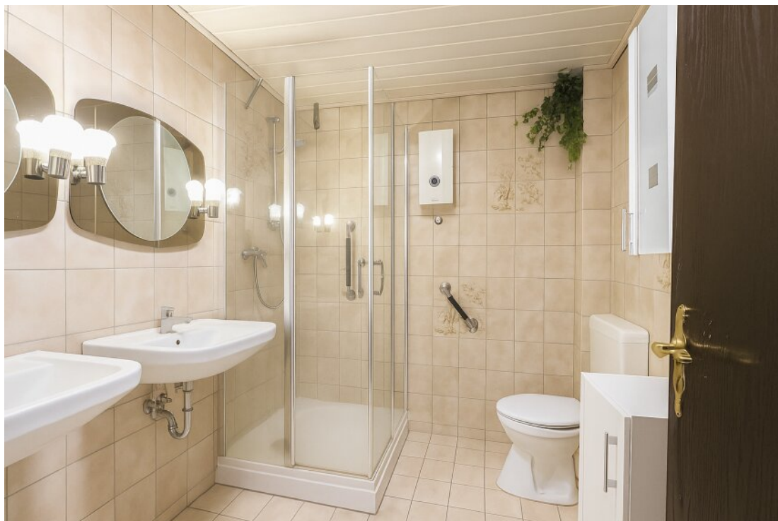
OG modernisiertes Duschbad