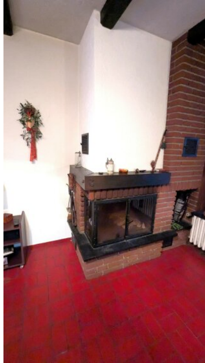
Warmluft-Kamin im Lebensraum